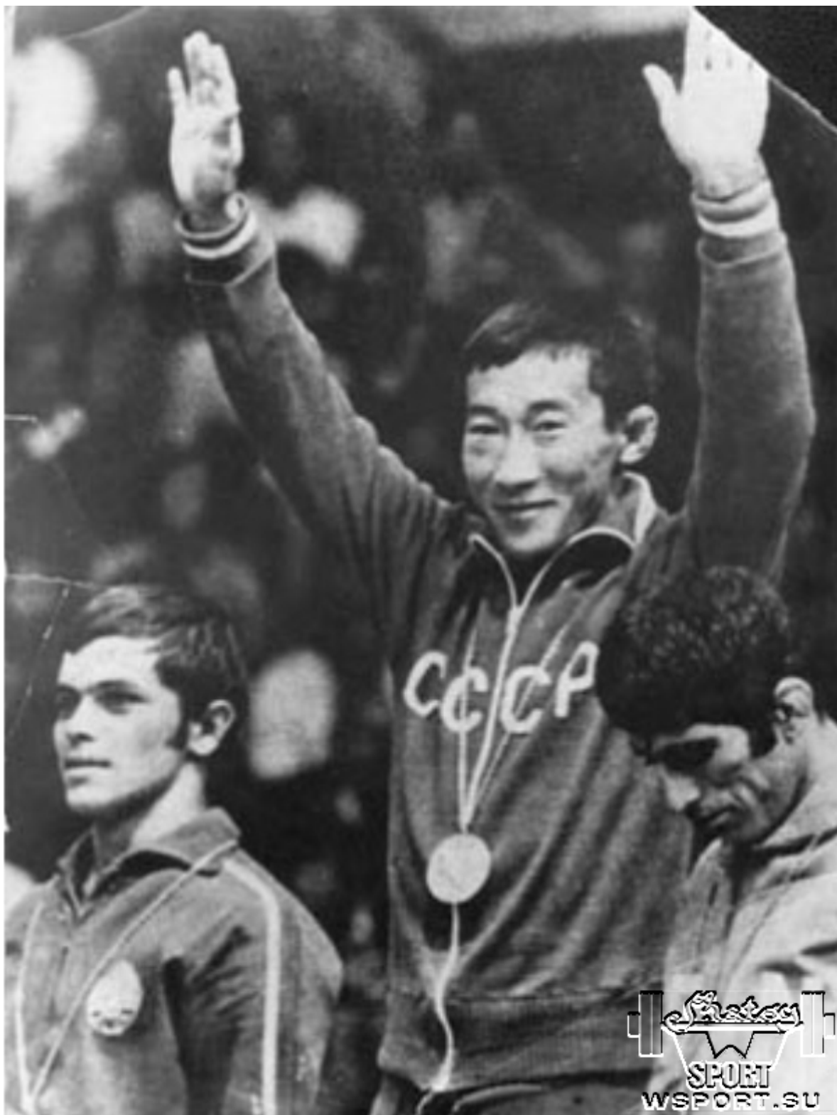
Роман Дмитриев с золотой медалью Олимпиады-1972

Надо сказать, что поражение на Олимпийских играх стало первой и последней неудачей великого иранского борца Ибрахима Джавади на международной арене. Почин Романа Дмитриева поддержали: Загалав Абдулбеков из Дагестана (до 57 кг), ставший первым на Северном Кавказе олимпийским чемпионом, Леван Тедиашвили из