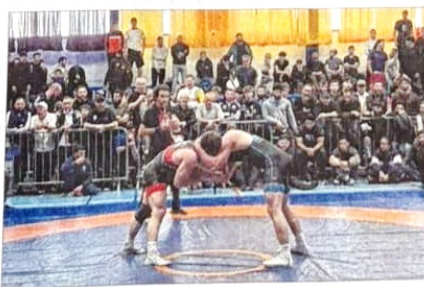
Wettkämpfe auf hohem Niveau am Samstag in Kelmis