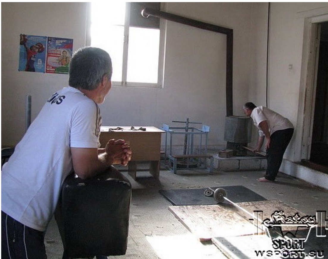
В своем зале в Урус-Мартане