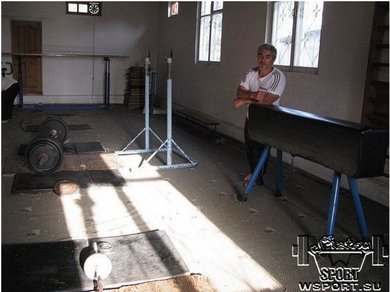
В своем зале в Урус-Мартане