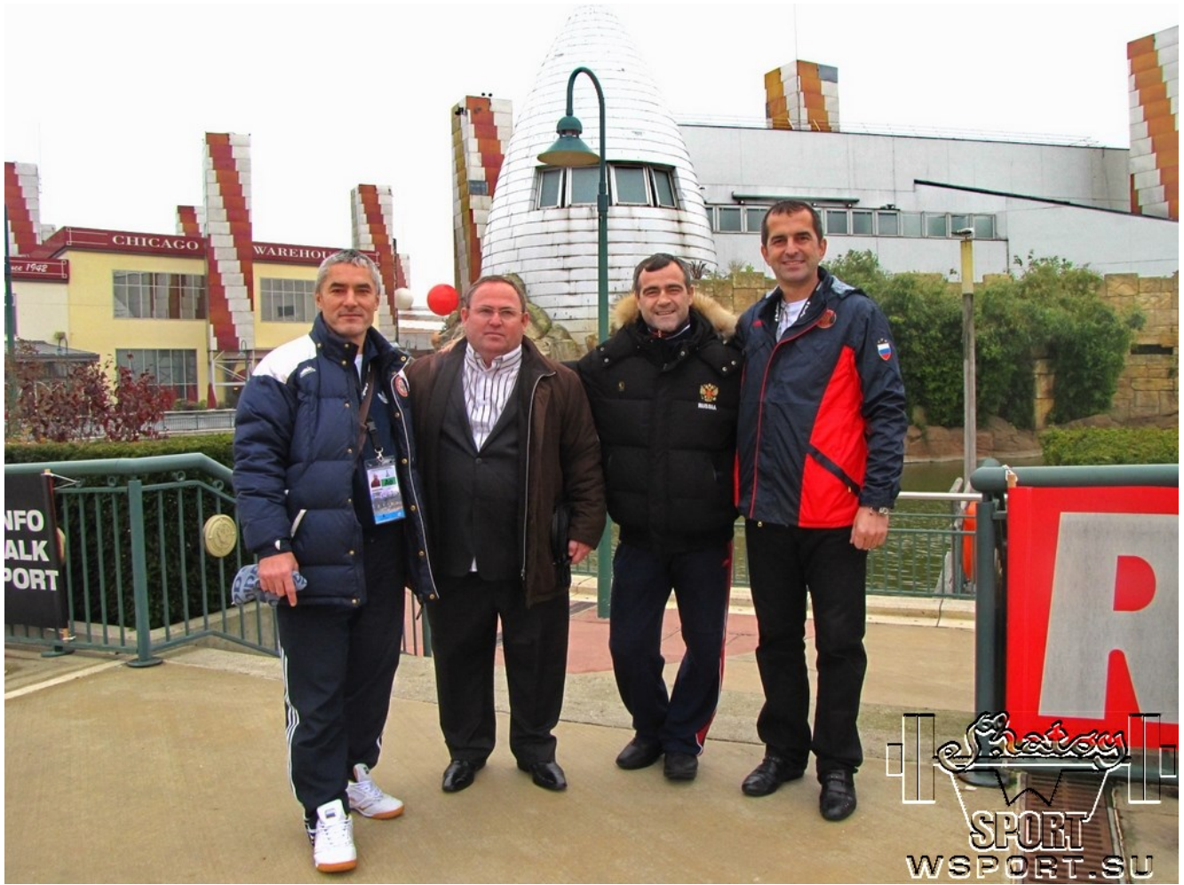
Чемпионат мира-2011, Париж.