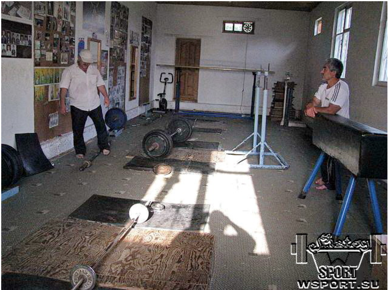
В своем зале в Урус-Мартане