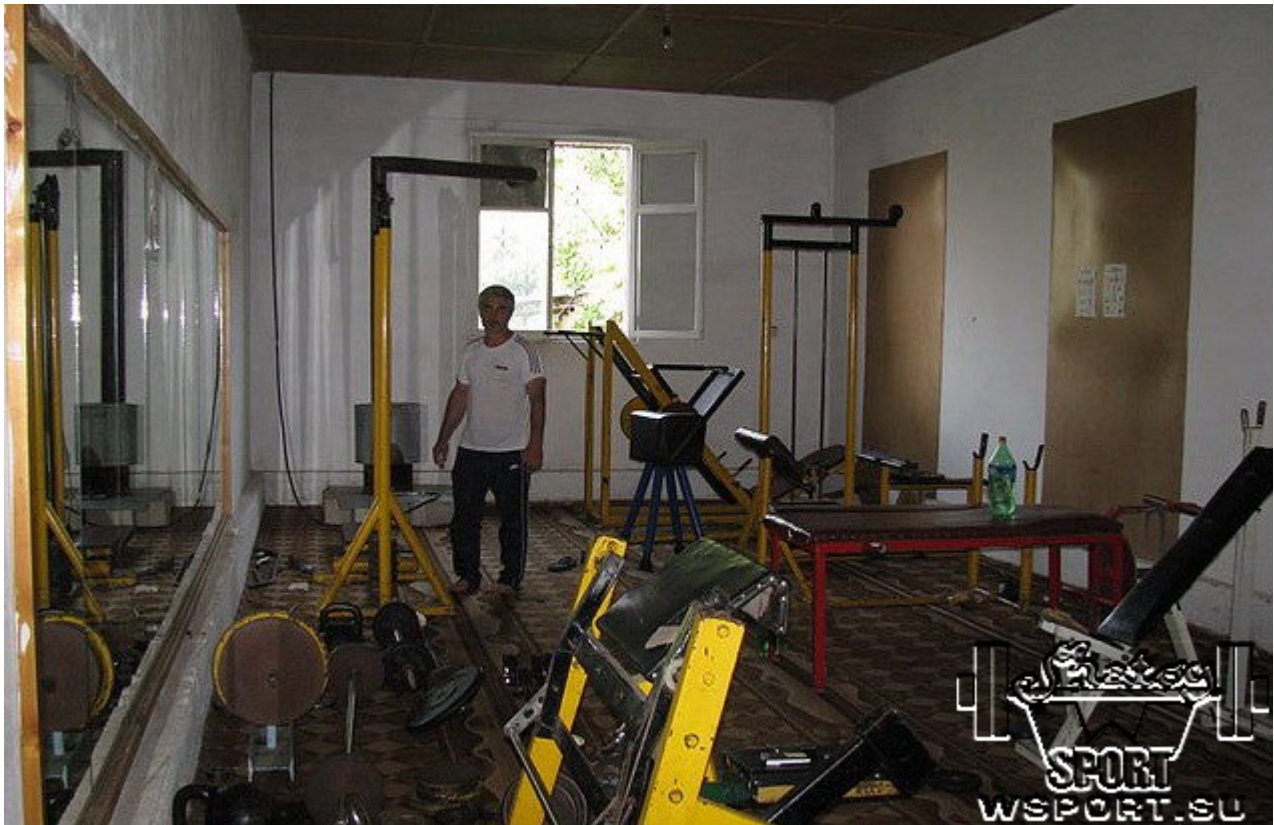
В своем зале в Урус-Мартане