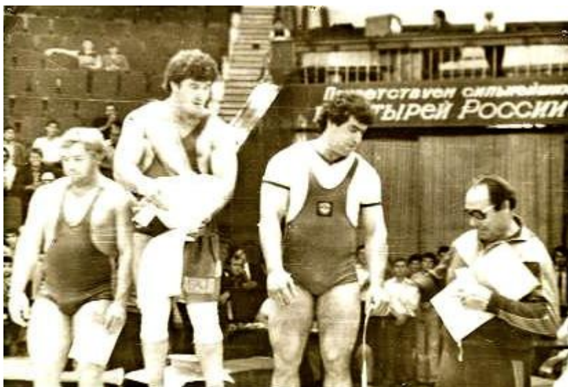
Осташко с учеником на награждении