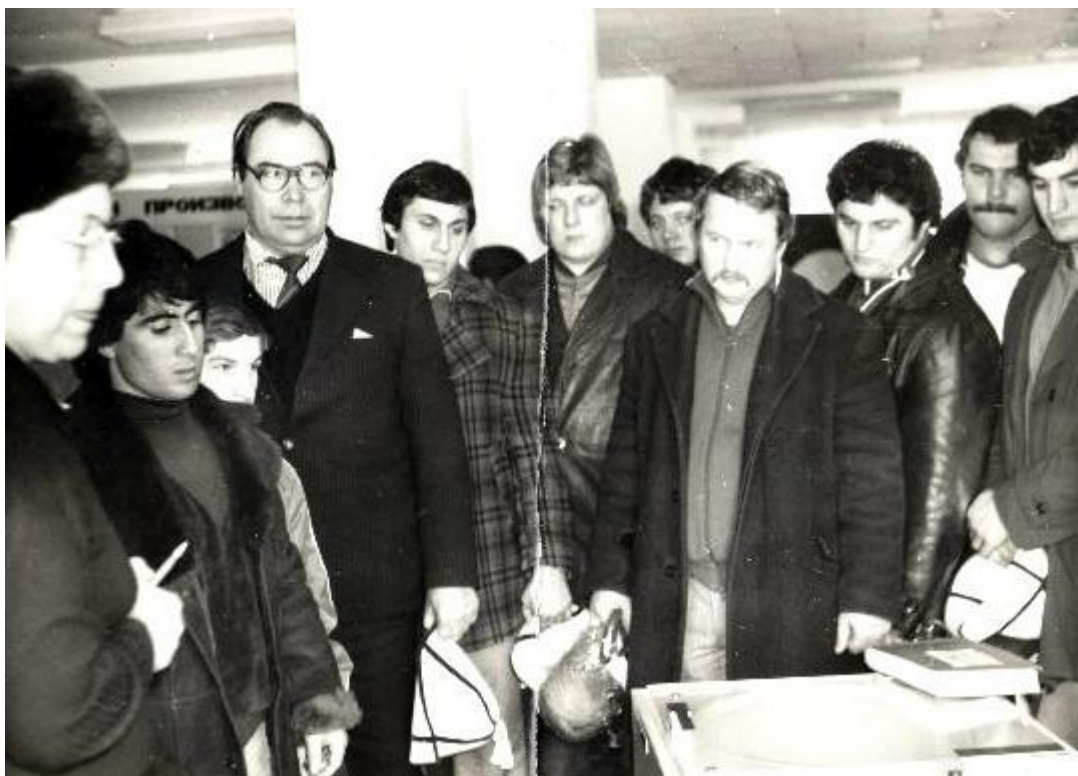
Со сборной СССР.