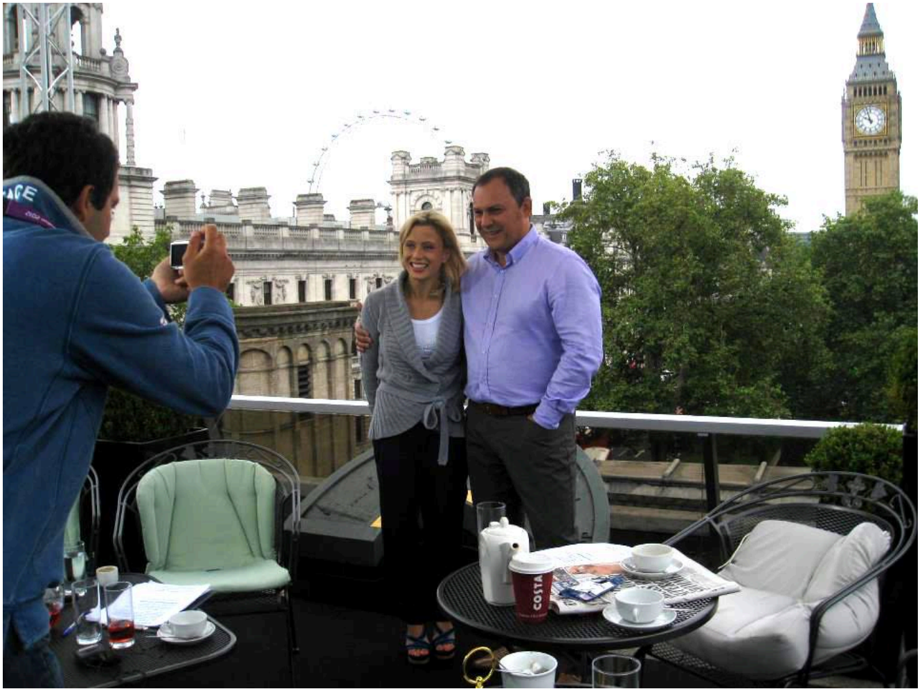
С двукратной олимпийской чемпионкой по спортивной гимнастике Еленой Замолодчиковой