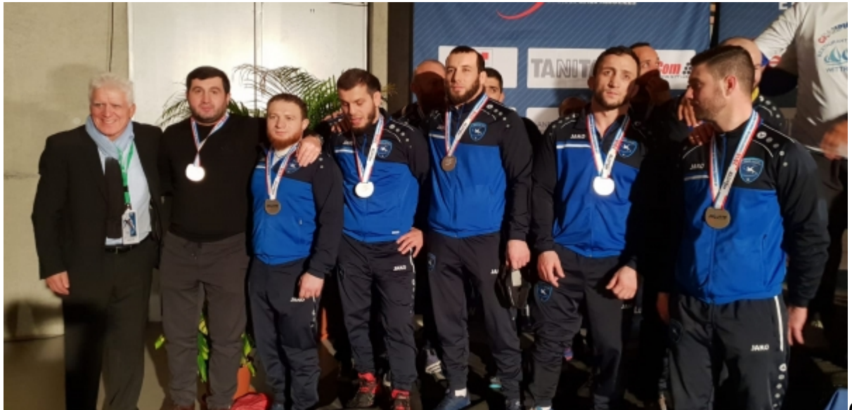
Серебряный призер командного чемпионата Франции – клуб Соттевиль-ле-Руан