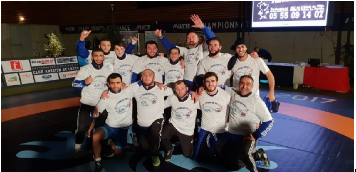
Обладатель командного чемпионата Франции – клуб Сарргемин