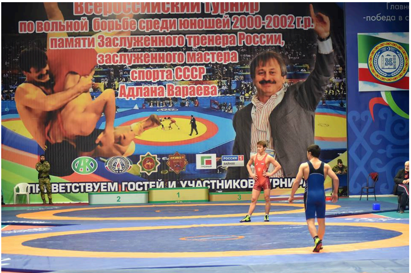
1-й Всероссийский турнир памяти Адлана Вараева