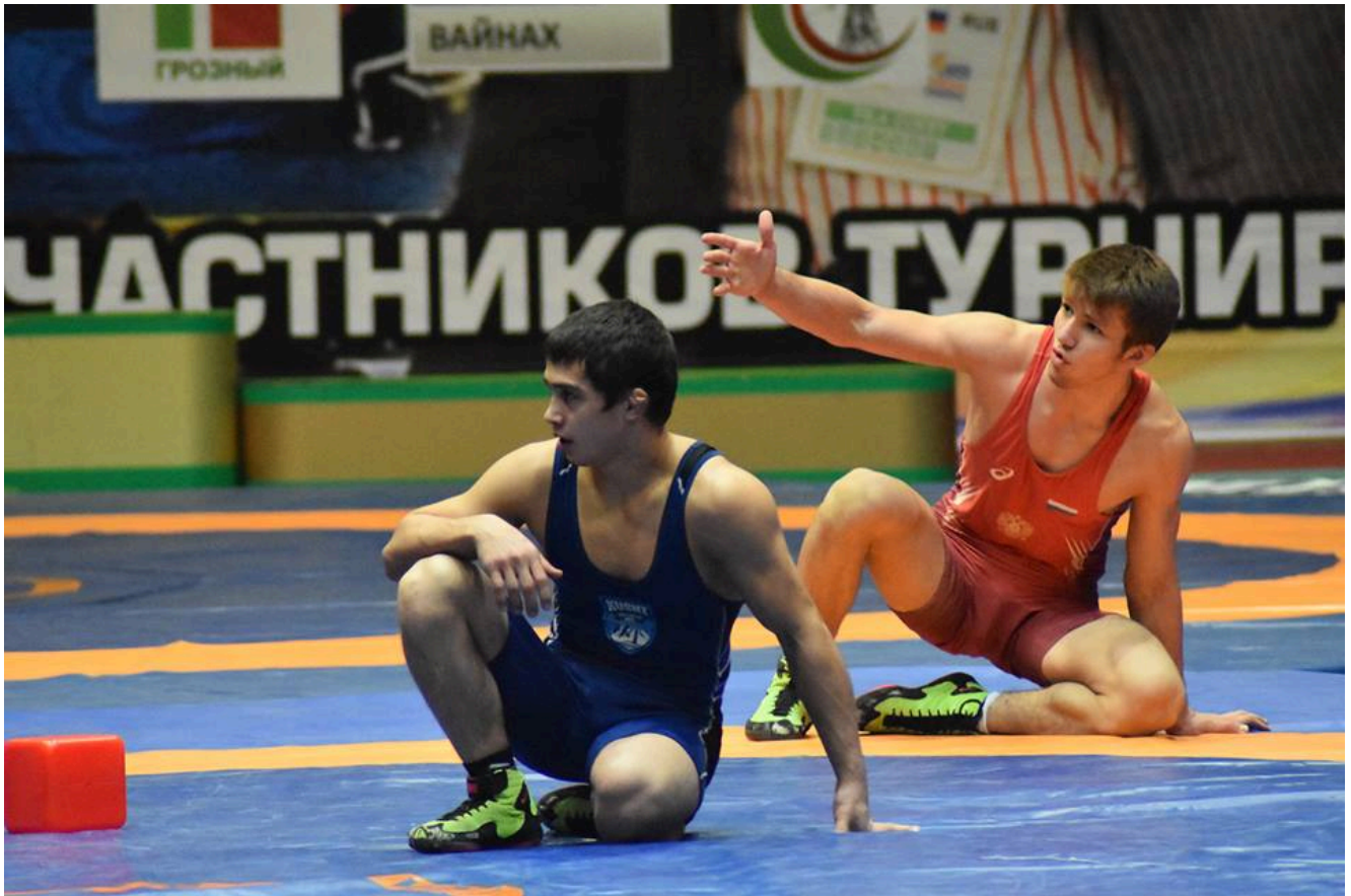
1-й Всероссийский турнир памяти Адлана Вараева