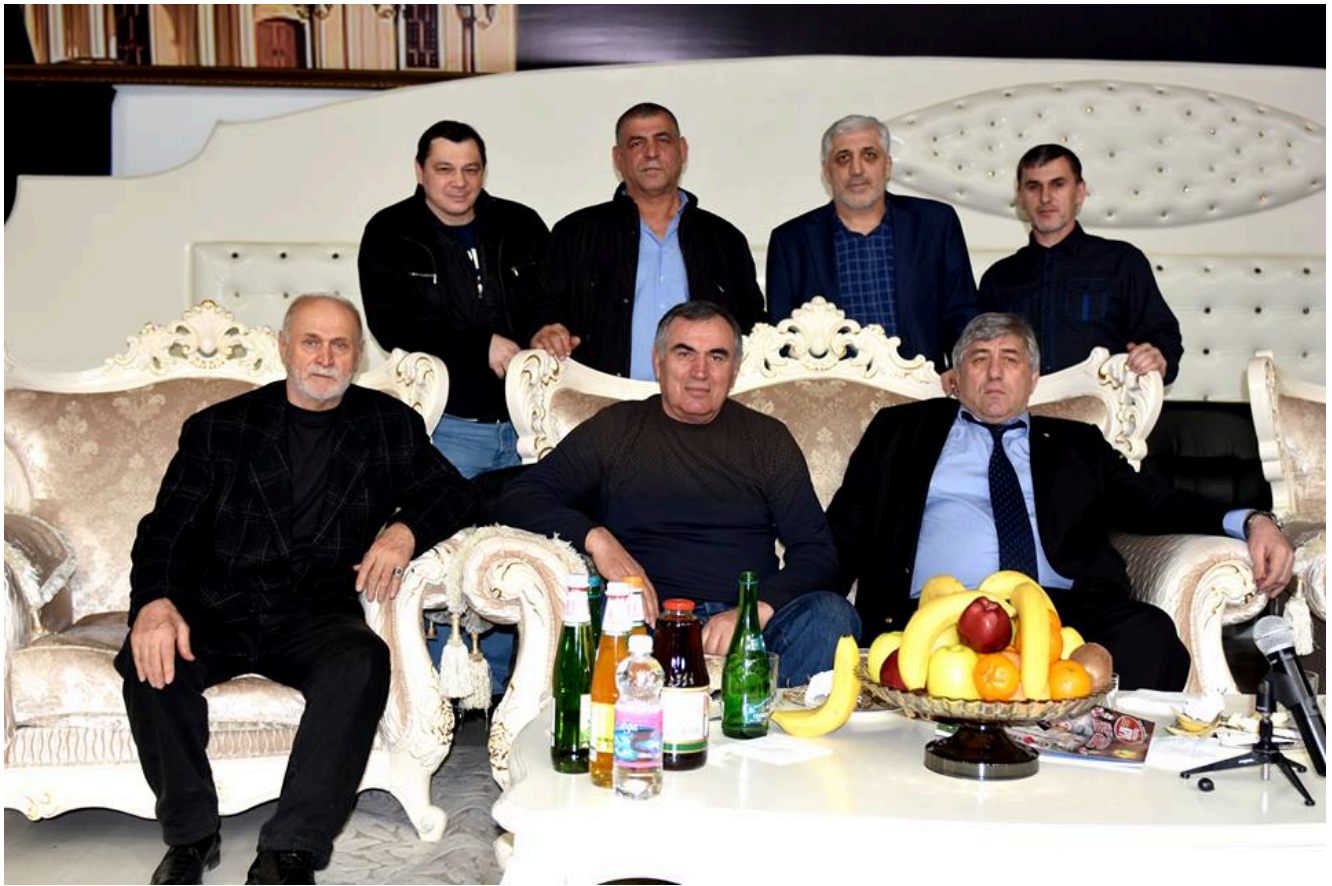
1-й Всероссийский турнир памяти Адлана Вараева. Почетные гости.