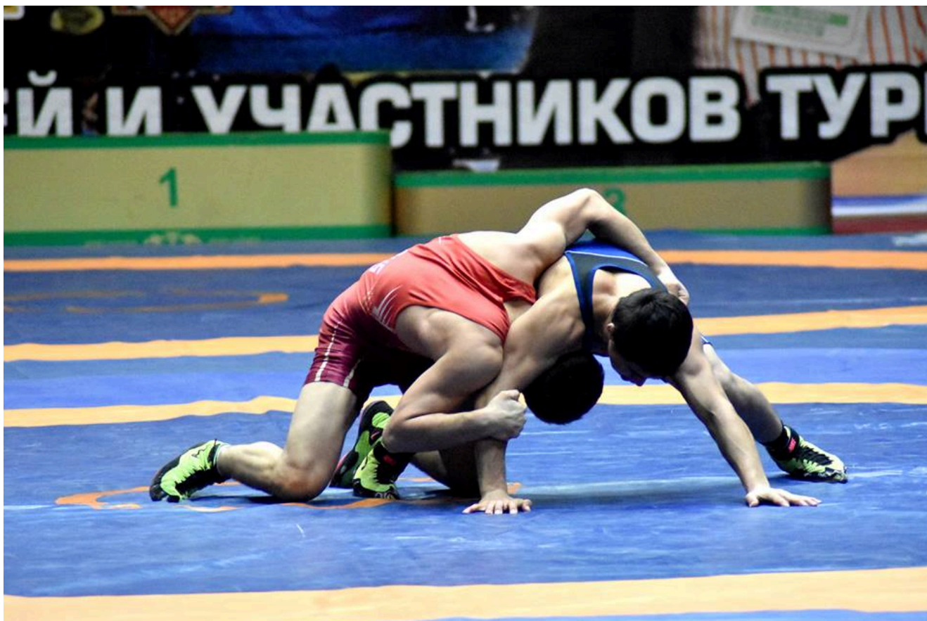
1-й Всероссийский турнир памяти Адлана Вараева