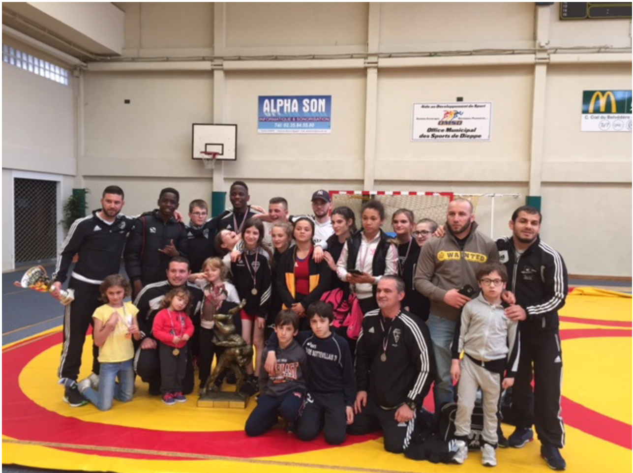
Юношеская команда клуба из Соттевиль-ле-Руан