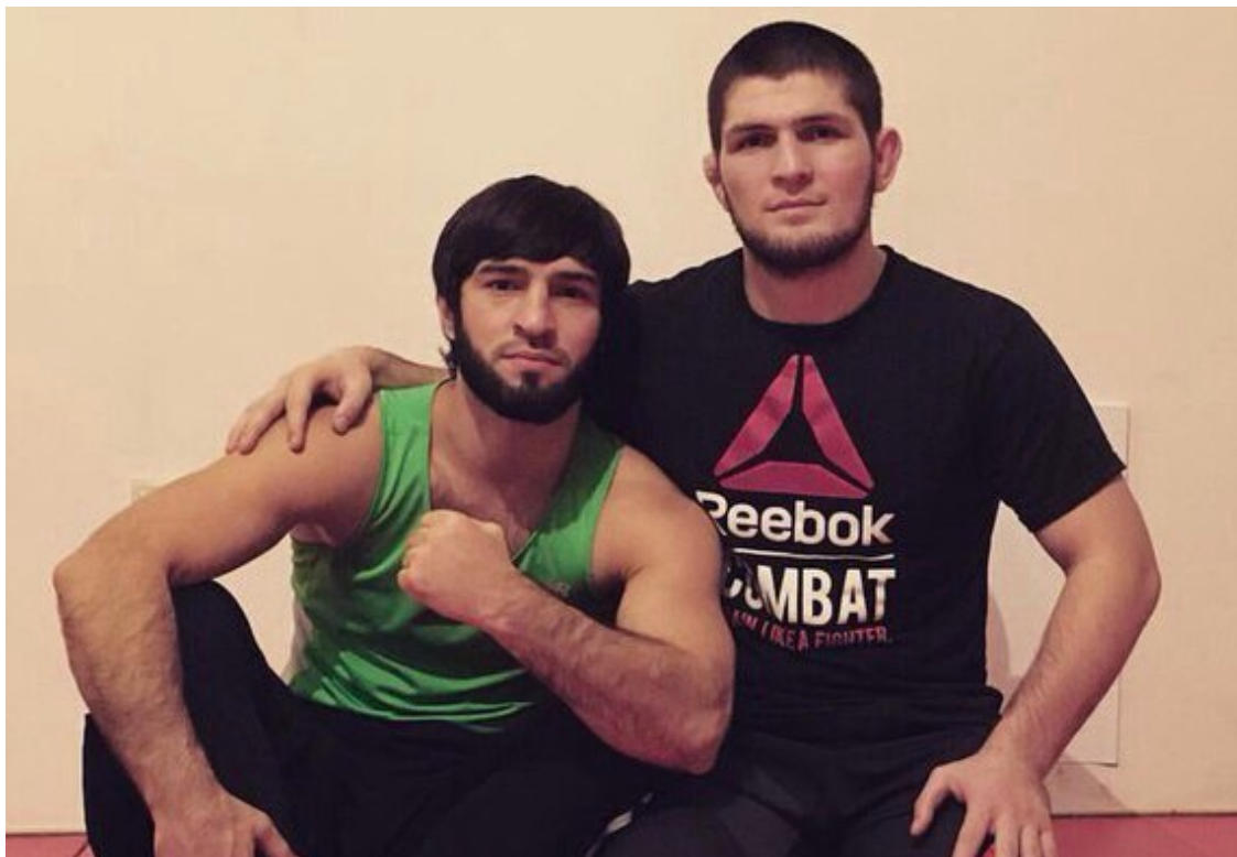
Зубайра Тухугов и Хабиб Нурмагомедов