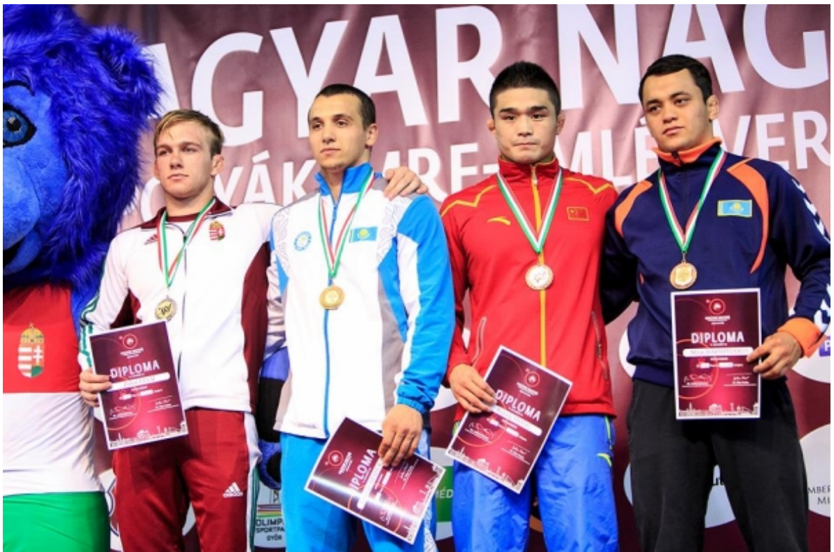
Тамерлан Шадукаев (Казахстан) – победитель Гран При Венгрия