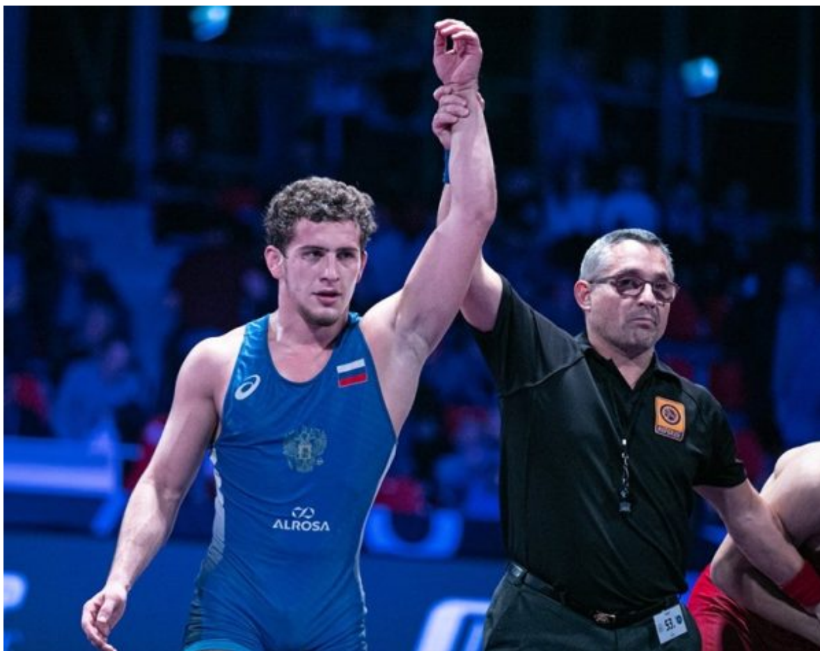
Разамбек Жамалов – чемпион мира -19 среди молодежи до 23 лет