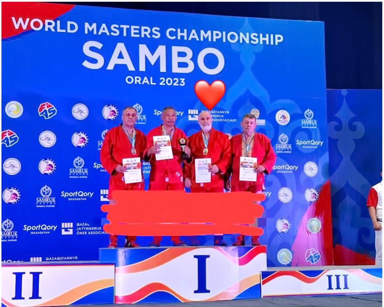
Бронзовый призер чемпионата мира по самбо Зайнди Абубакаров