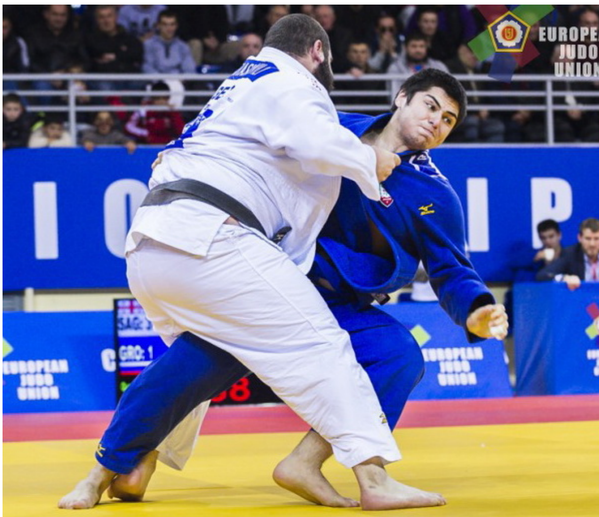
Тамерлан Башаев.