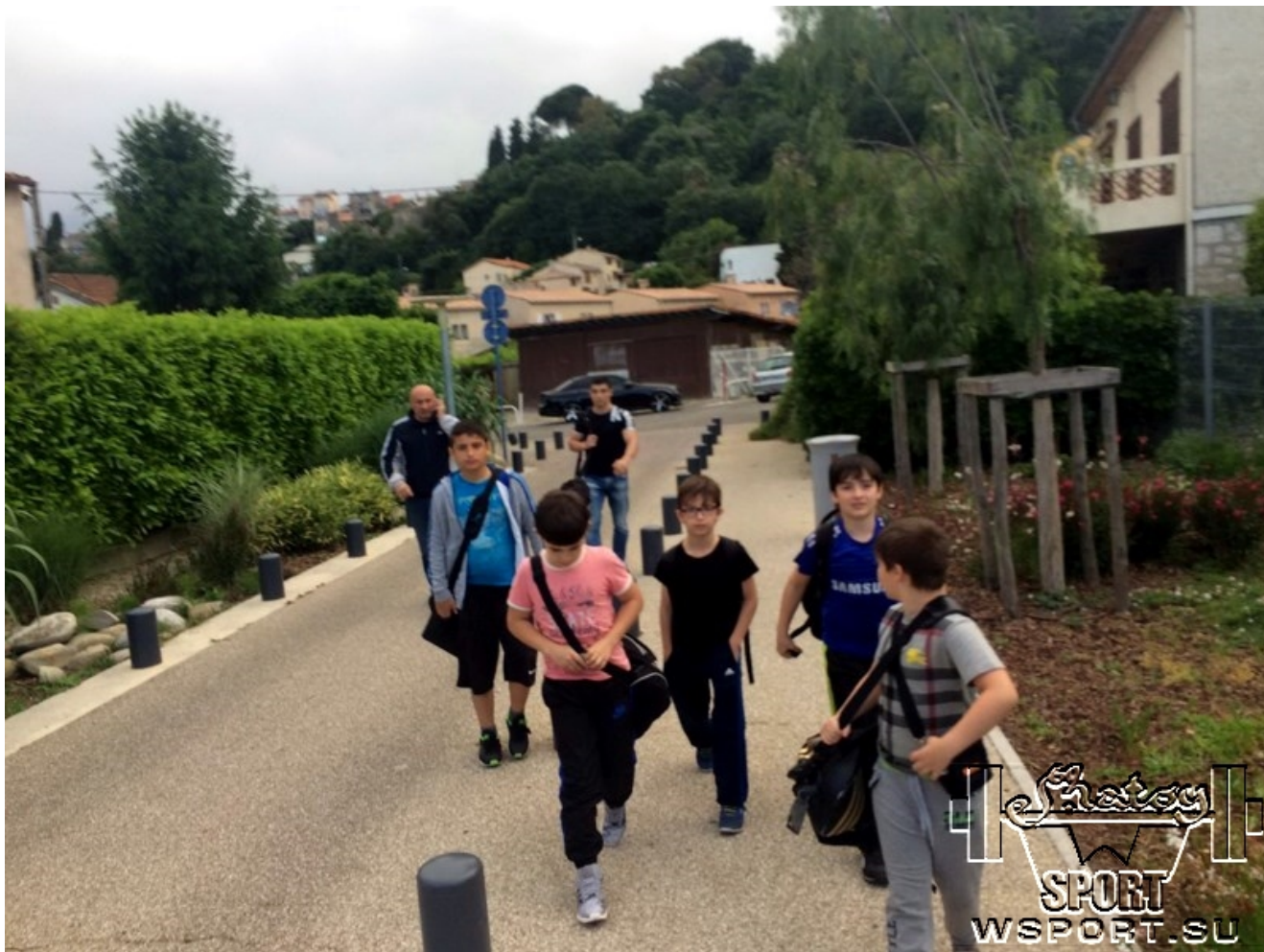
Команда Wayclub прибыла на турнир