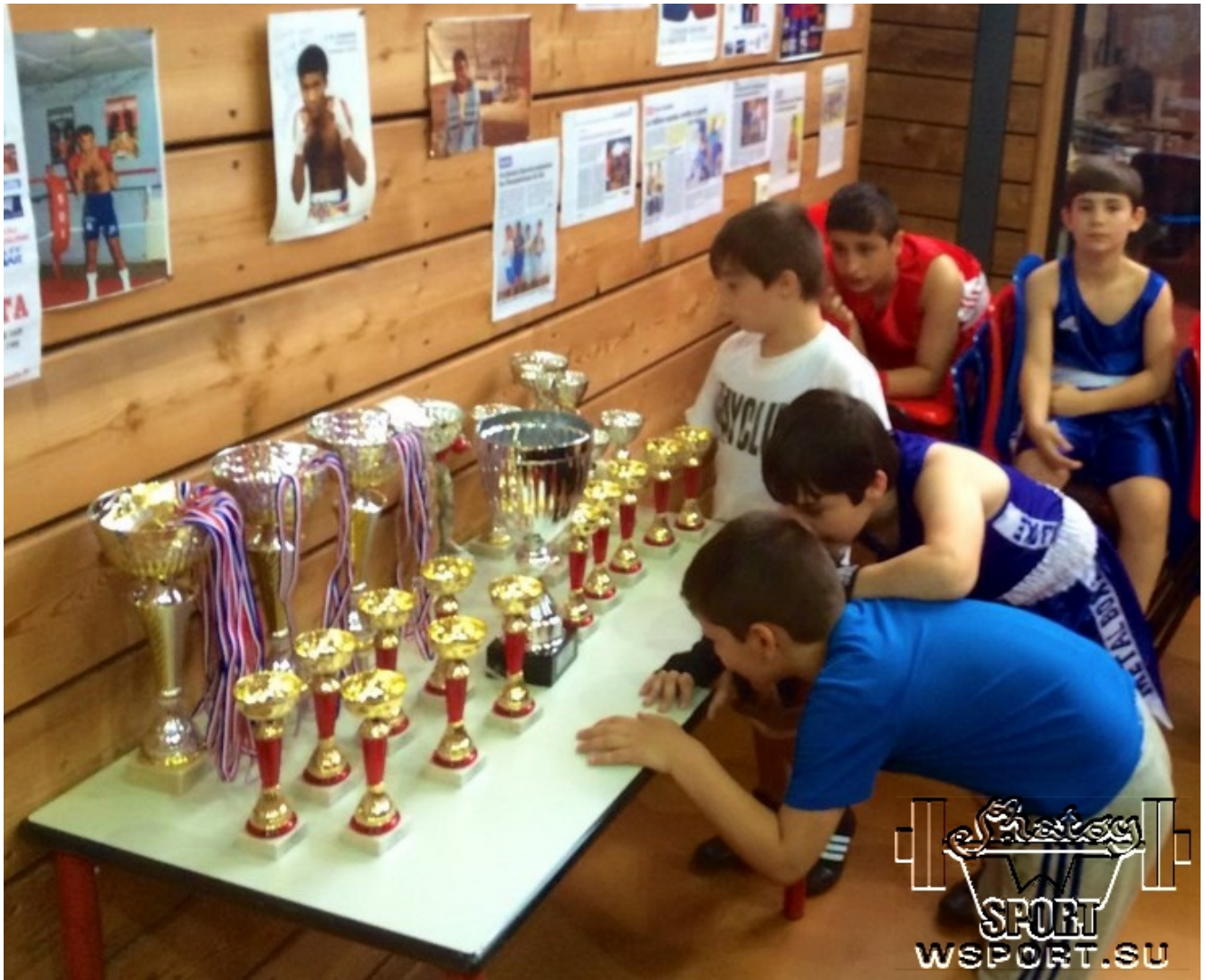
Ребята присматриваются к Кубкам