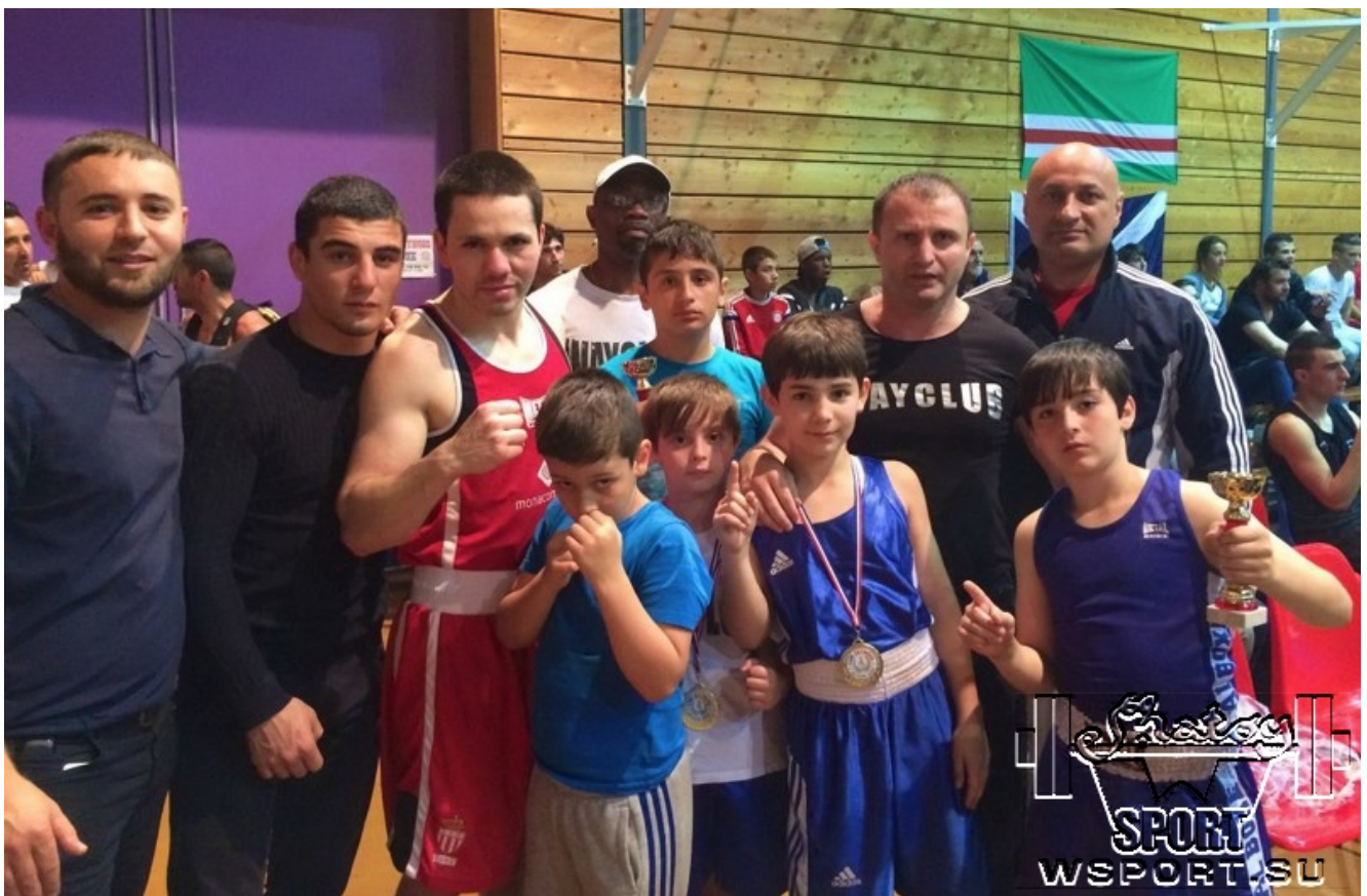
Команда Wayclub после турнира