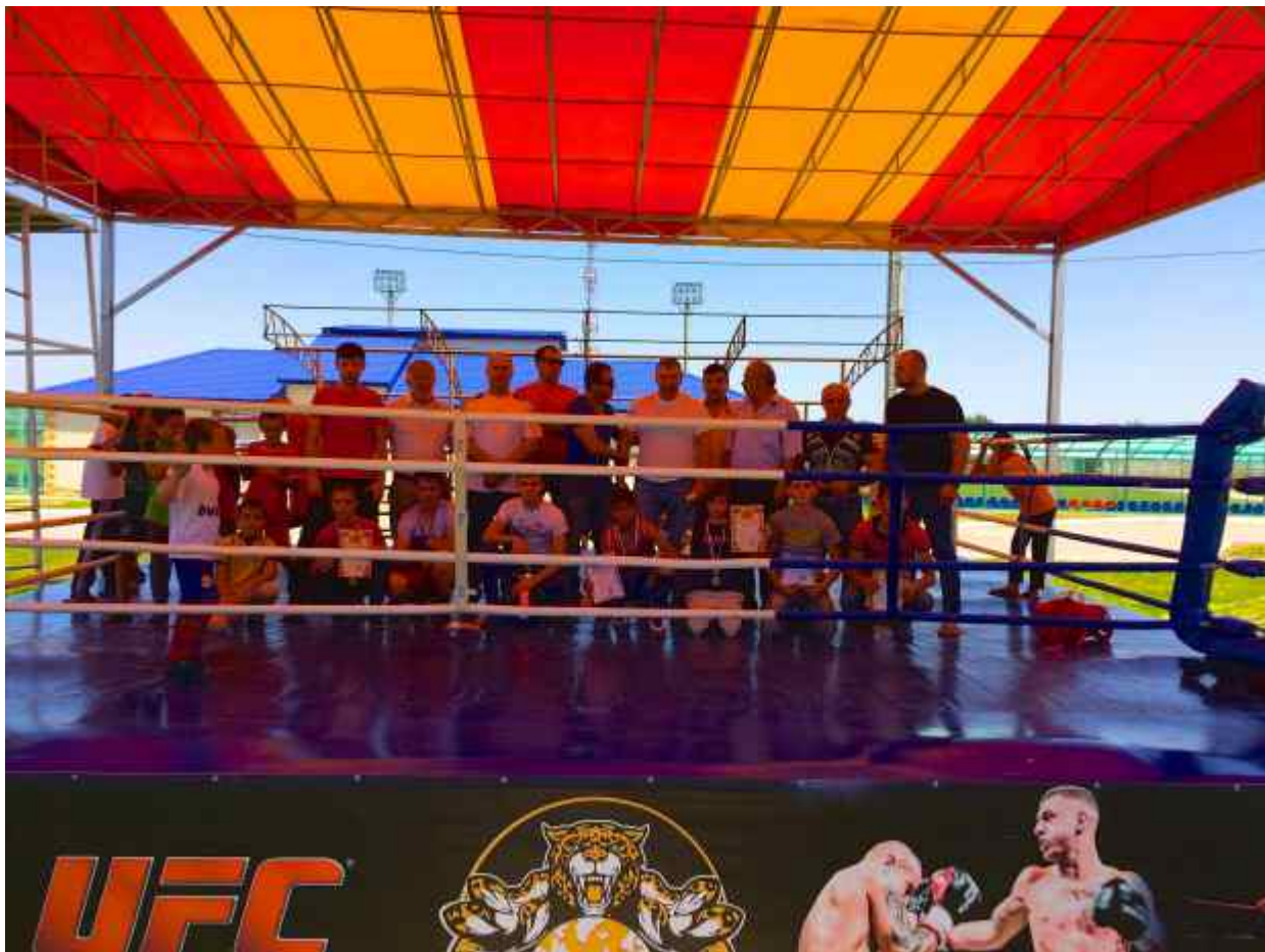
Организаторы турнира и тренеры