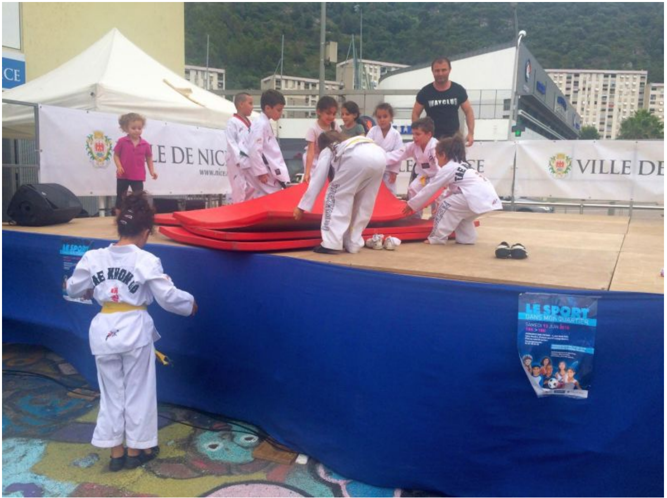
Подготовка места представлений