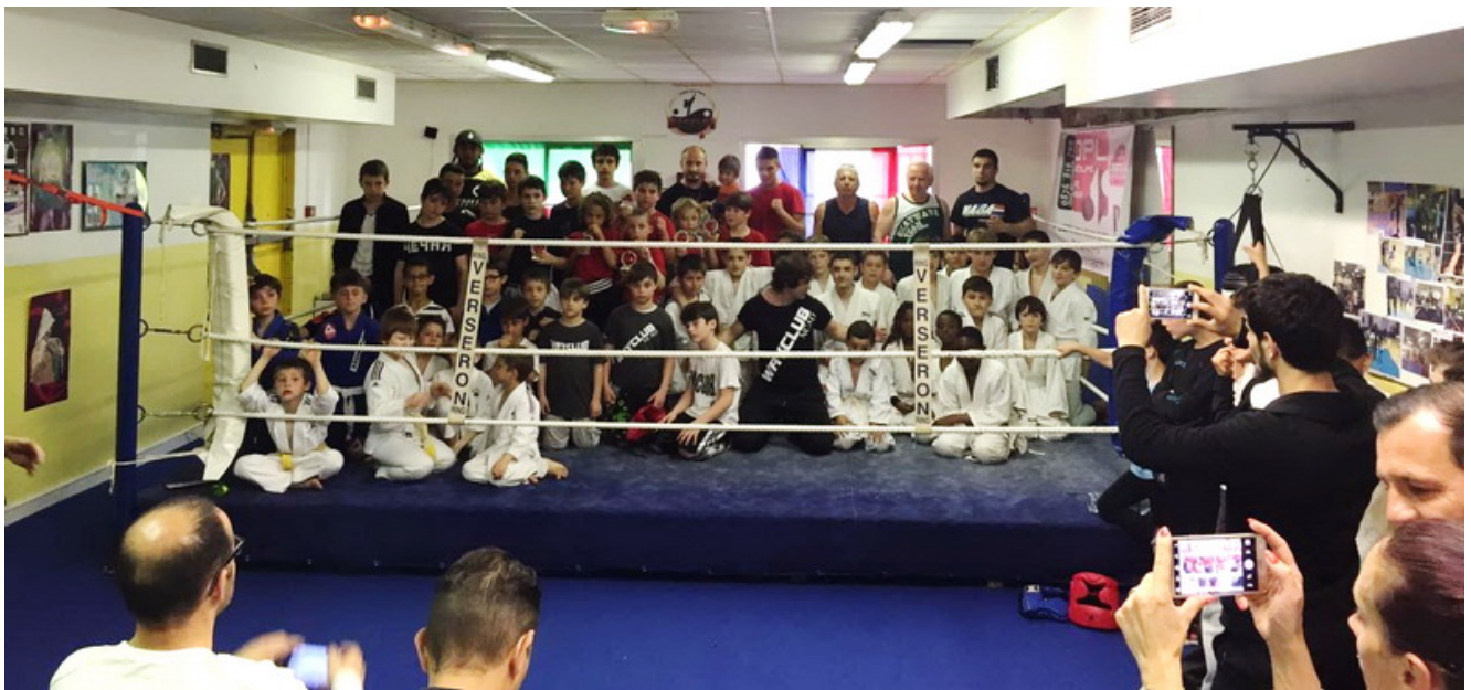
Участники 2-го Кубка Вайклуба после соревнований