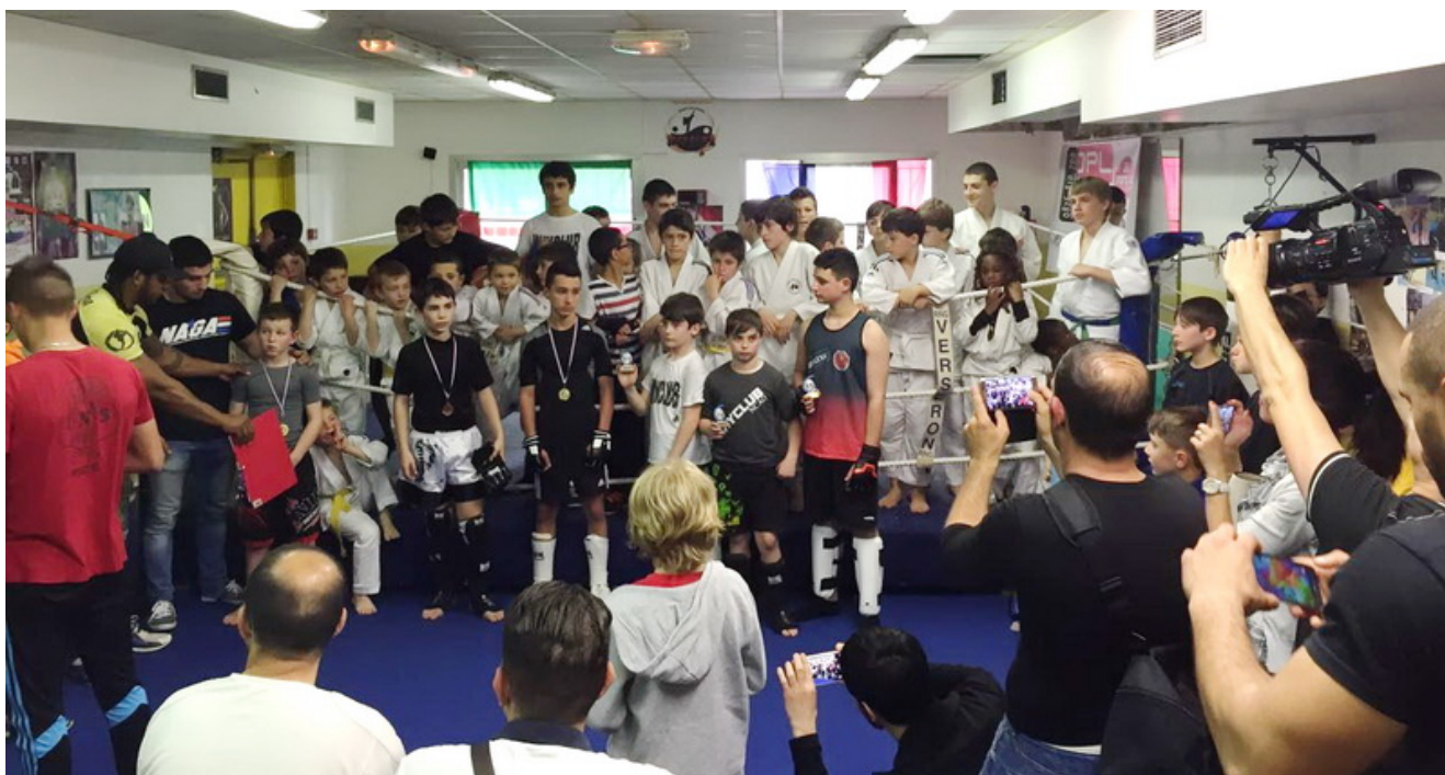
Участники 2-го Кубка Вайклуба после соревнований