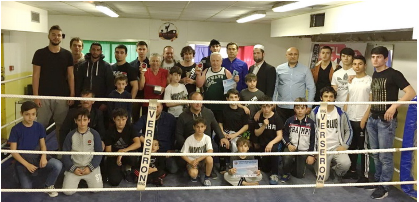
Участники и зрители 2-го Кубка Вайклуба после соревнований