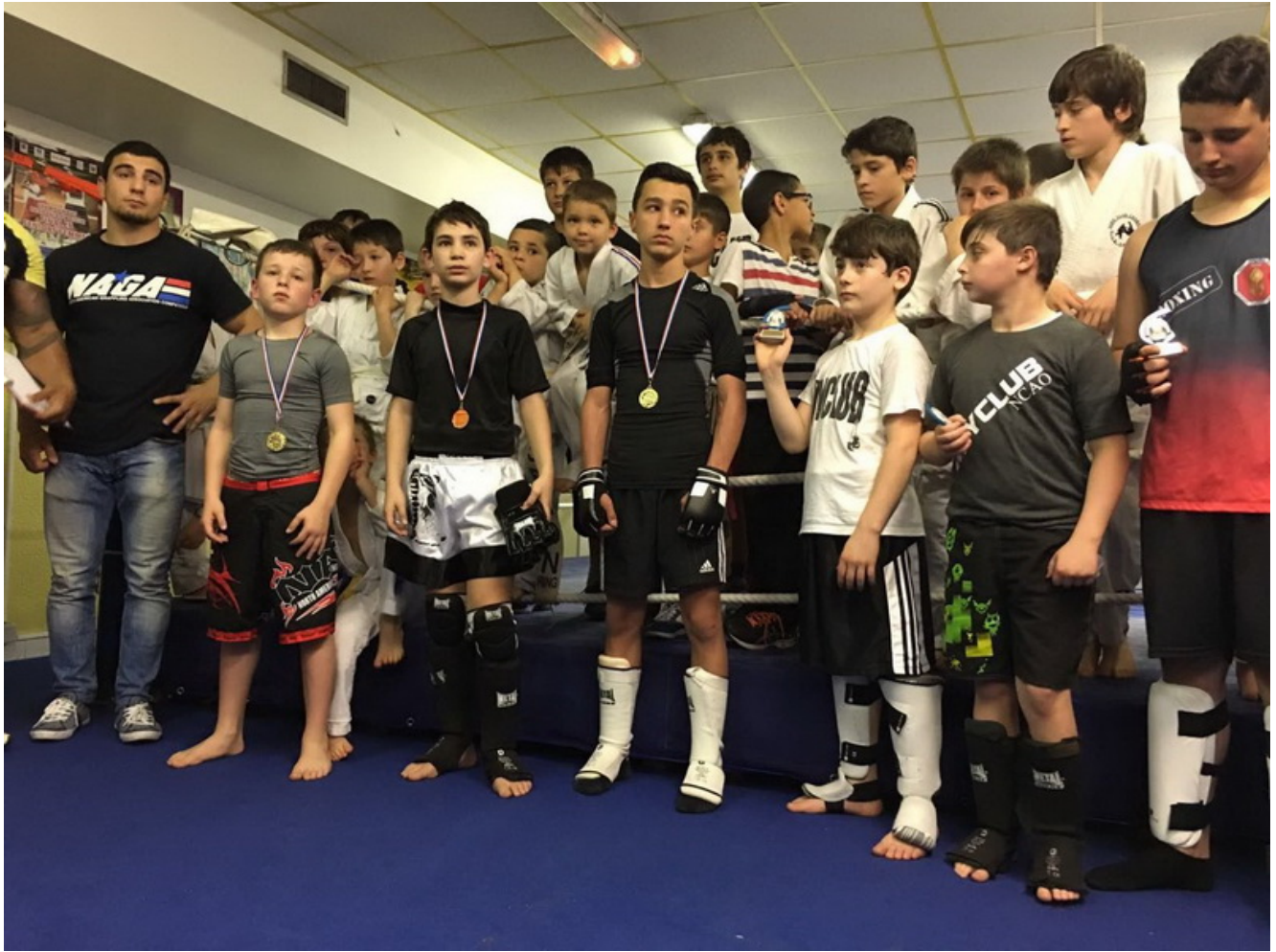
Участники 2-го Кубка Вайклуба после соревнований