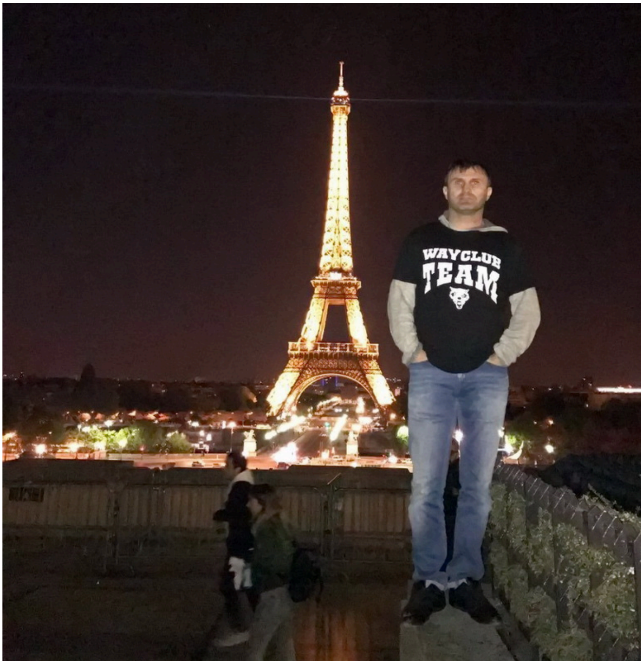
Wayclub засветился рядом с Эйфелевой башней.