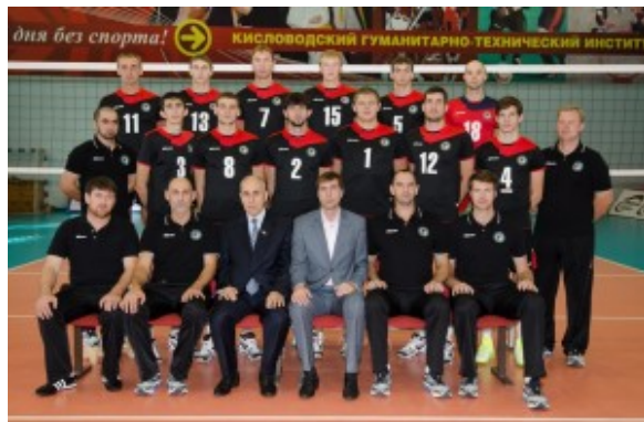
ВК «Грозный», 2012г.

В 2007 году «Грозный» дебютировал в первой лиге чемпионата России и заняв второе место вышел в высшую лигу «Б». В 2012 году клуб стал вторым в высшей лиге «А» и следующий сезон играл уже в российской Суперлиге.