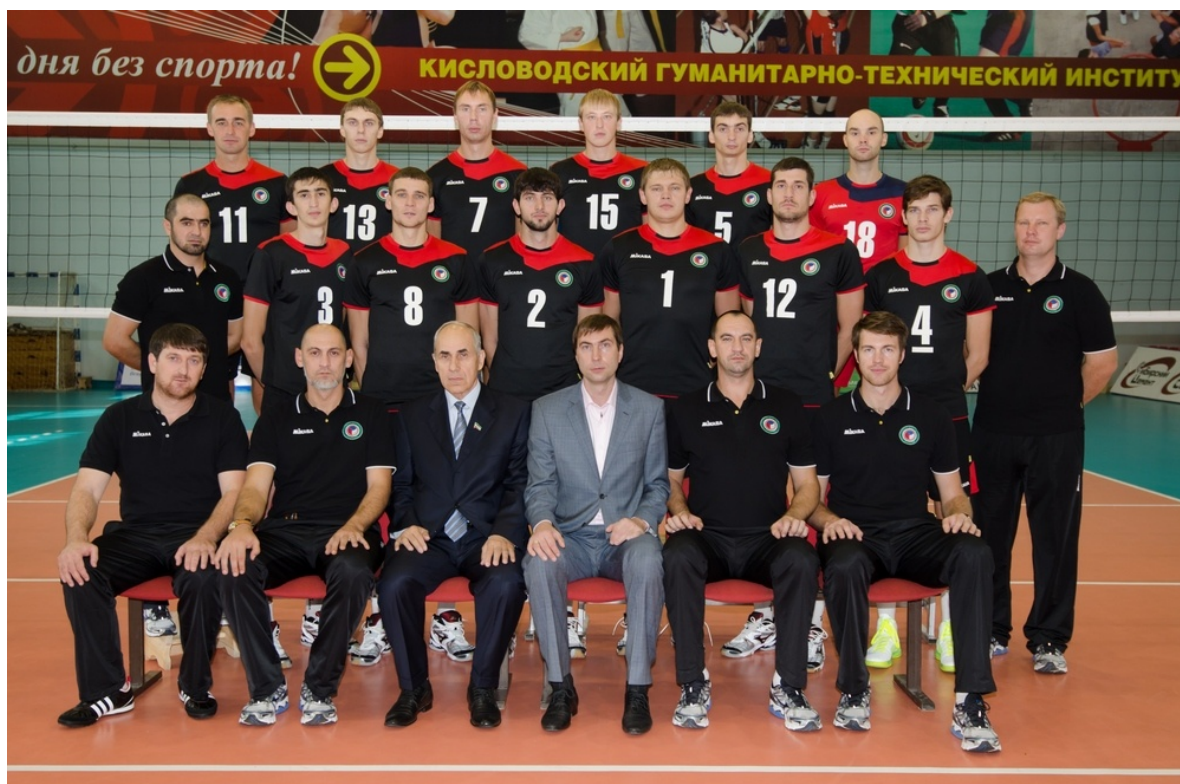
ВК «Грозный», 2012г.

В последнем сезоне в Суперлиге команда «Грозный» выиграла 2 матча из 26, набрала мизерные 7 очков, заняла последнее 14-е место и выбыла в высшую лигу «А». В результате очередной рокировки игроков с другими клубами, «Грозному» пришлось снова начинать сезон с новым составом и заново строить всю игру. Что и привело к закономерному, печальному итогу, когда пришлось распрощаться с Суперлигой. Такая ситуация, конечно-же, будет повторяться и в будущем, пока в республике не будет создана собственная волейбольная база. Необходимо открывать секции волейбола, привлекать туда детей, создавать специализированные школы. Понятно, что в республике нет тренеров по волейболу. На первых порах можно пригласить их из других регионов, одновременно подготавливая свои кадры. И надо, как минимум, иметь в Грозном хотя бы один специализированный зал волейбола, отвечающий международным стандартам. А то как-то смешно получается, команда играет в Суперлиге, а зала приличного у нее и нет.