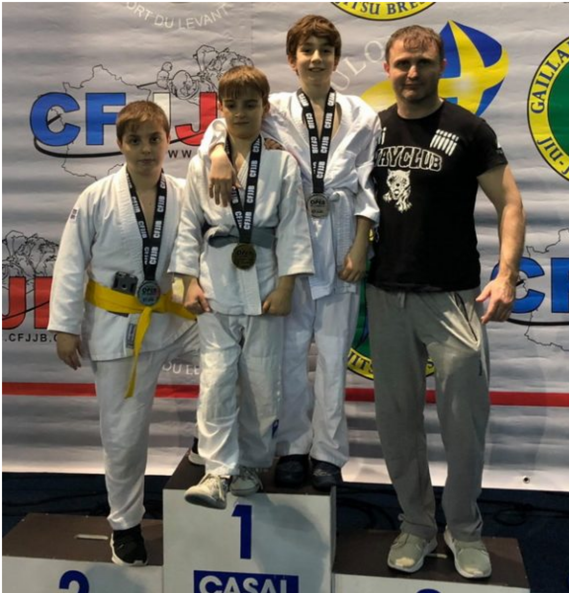
Команда Вайклуб / Wayclub на турнире в Тулоне.