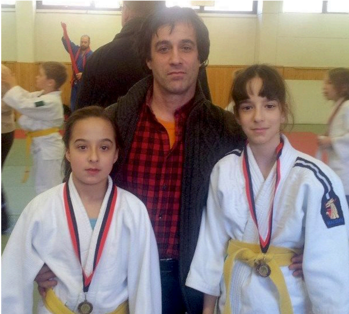
Хеда и Эниса с отцом, известным чеченским художником Вахарсолтом Балатхановым