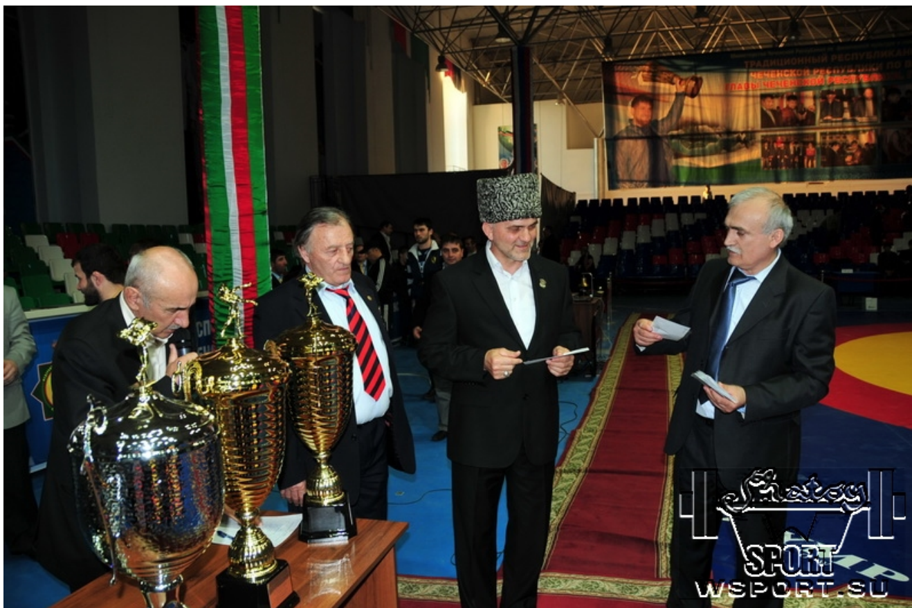
Парламентский турнир 2013г.