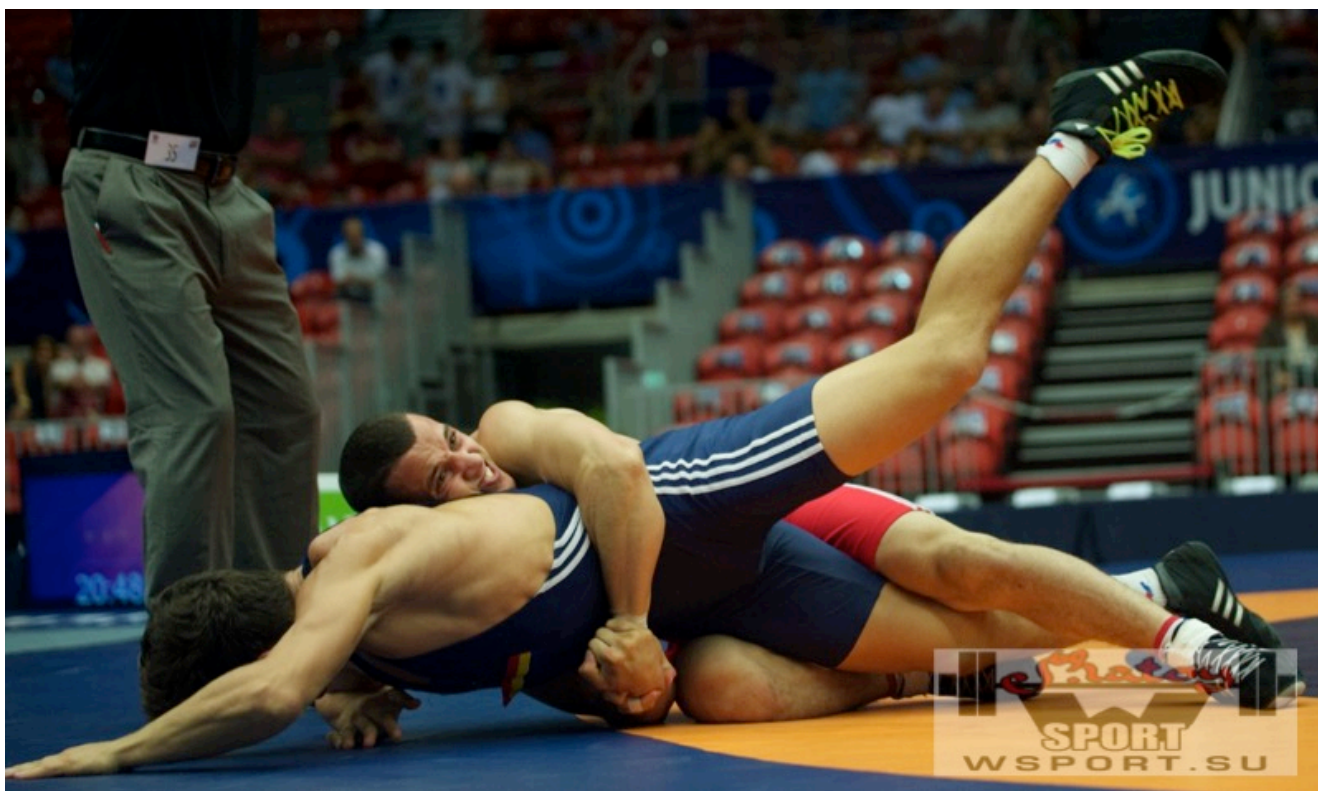
Тамерлан Шадукаев - чемпион мира-2016 среди юниоров