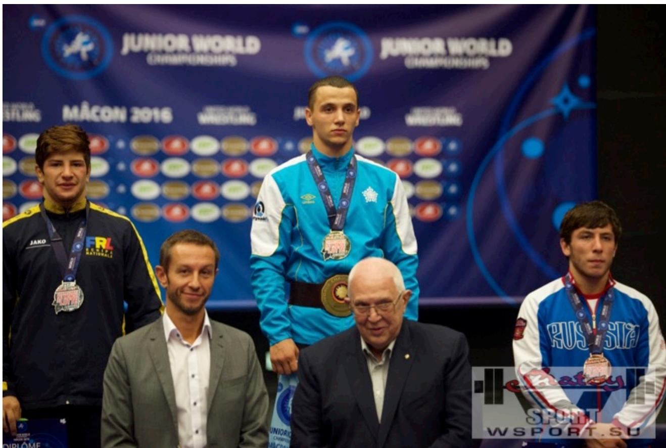
Тамерлан Шадукаев - чемпион мира-2016 среди юниоров