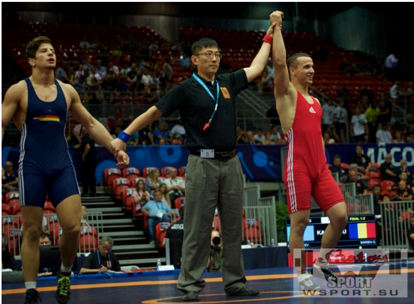
Тамерлан Шадукаев - чемпион мира-2016 среди юниоров