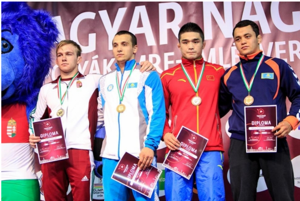
Тамерлан Шадукаев (Казахстан) – победитель Гран При Венгрия