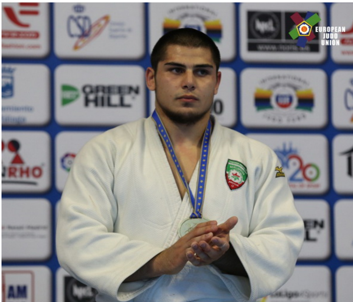
Тамерлан Башаев.