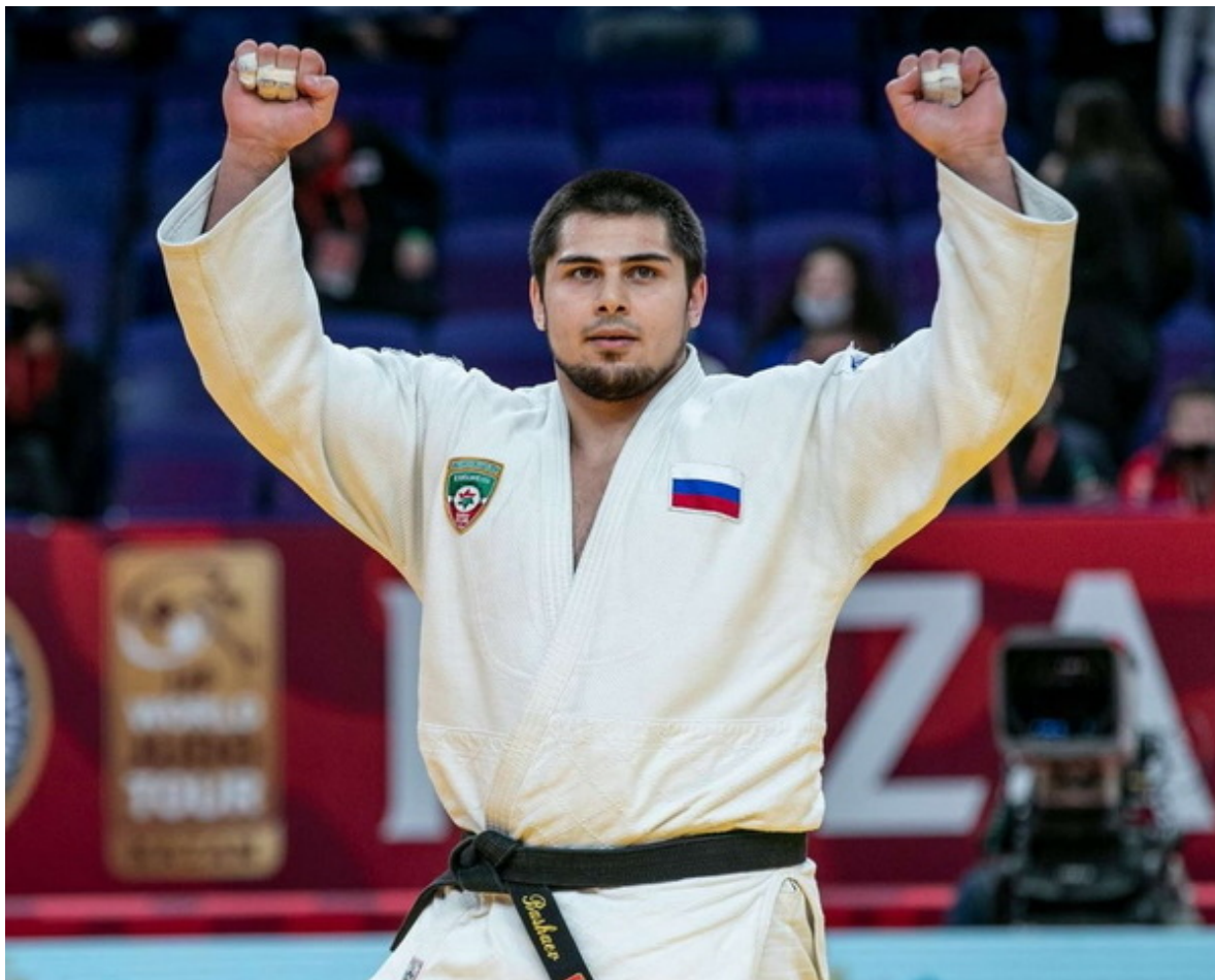
Победитель Большого Шлема Казани Тамерлан Башаев