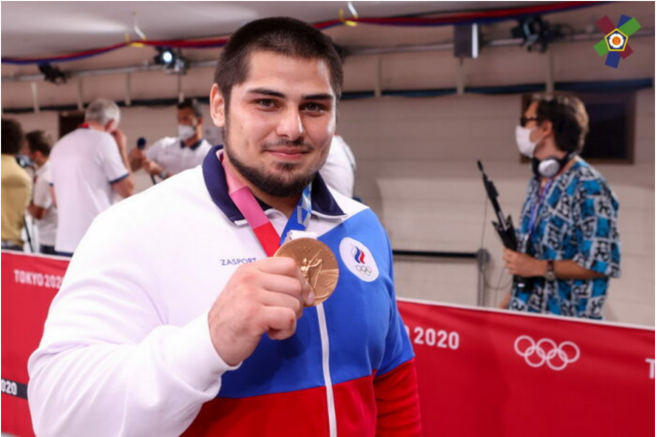
Бронзовый призер Олимпиады-20 Тамирлан Башаев