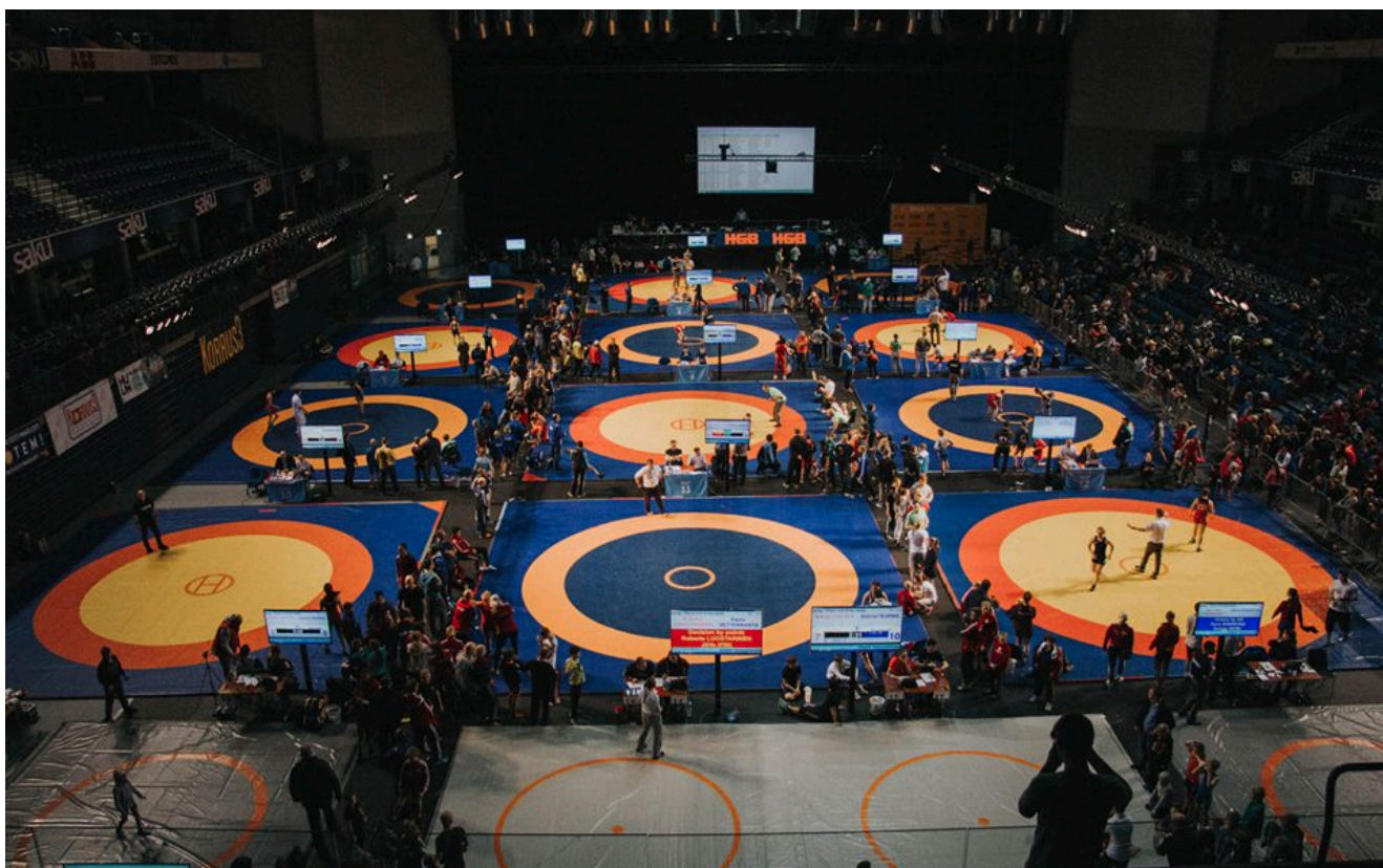
Соревнования идут на 12 коврах