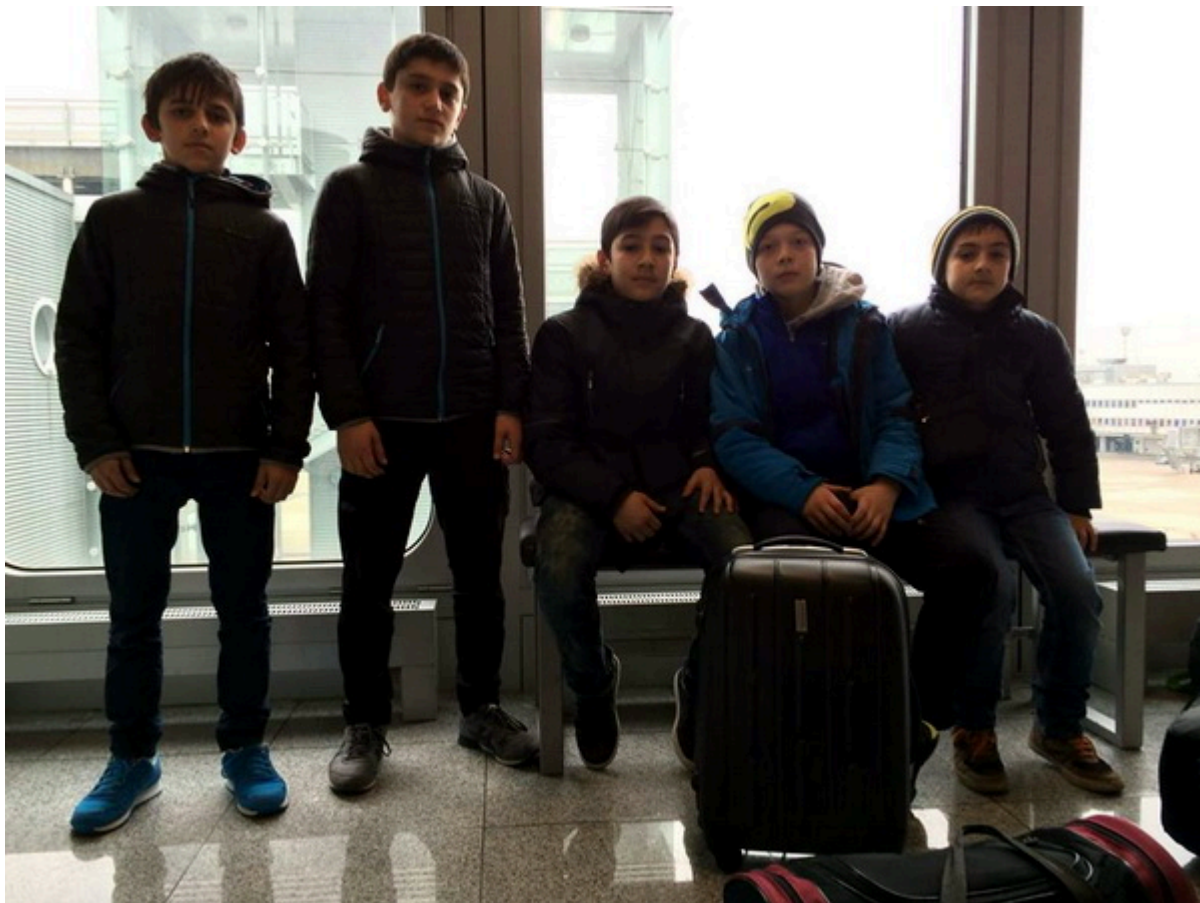
Борцы клуба "Вайнах-Эссалем" на пути в Таллин