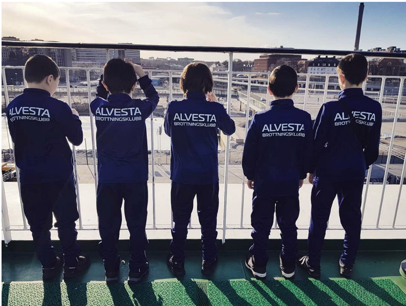
Команда БК Альвеста из Швеции прибыла в Таллин.