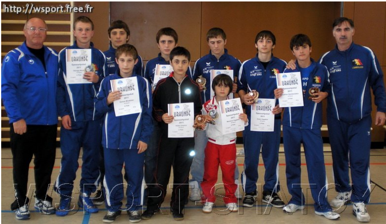
Команда "Раерен 2006"