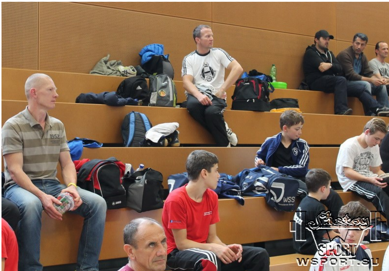
Знаменитый Александр Ляйпольд на трибуне.