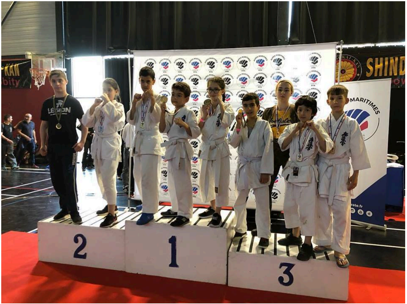
Команда каратистов клуба "Легион".