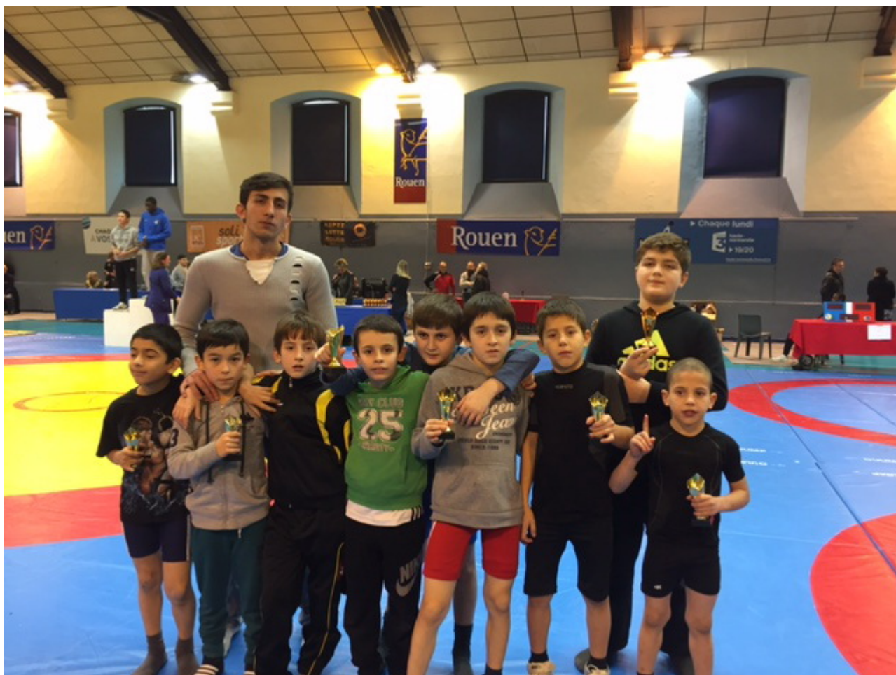
Вайнахские борцы на первенстве Нормандии