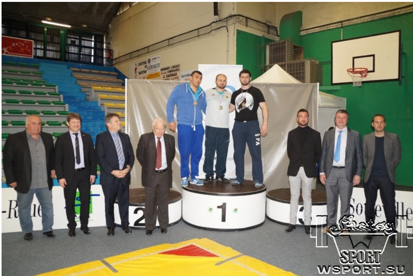
Призеры тяжелого веса