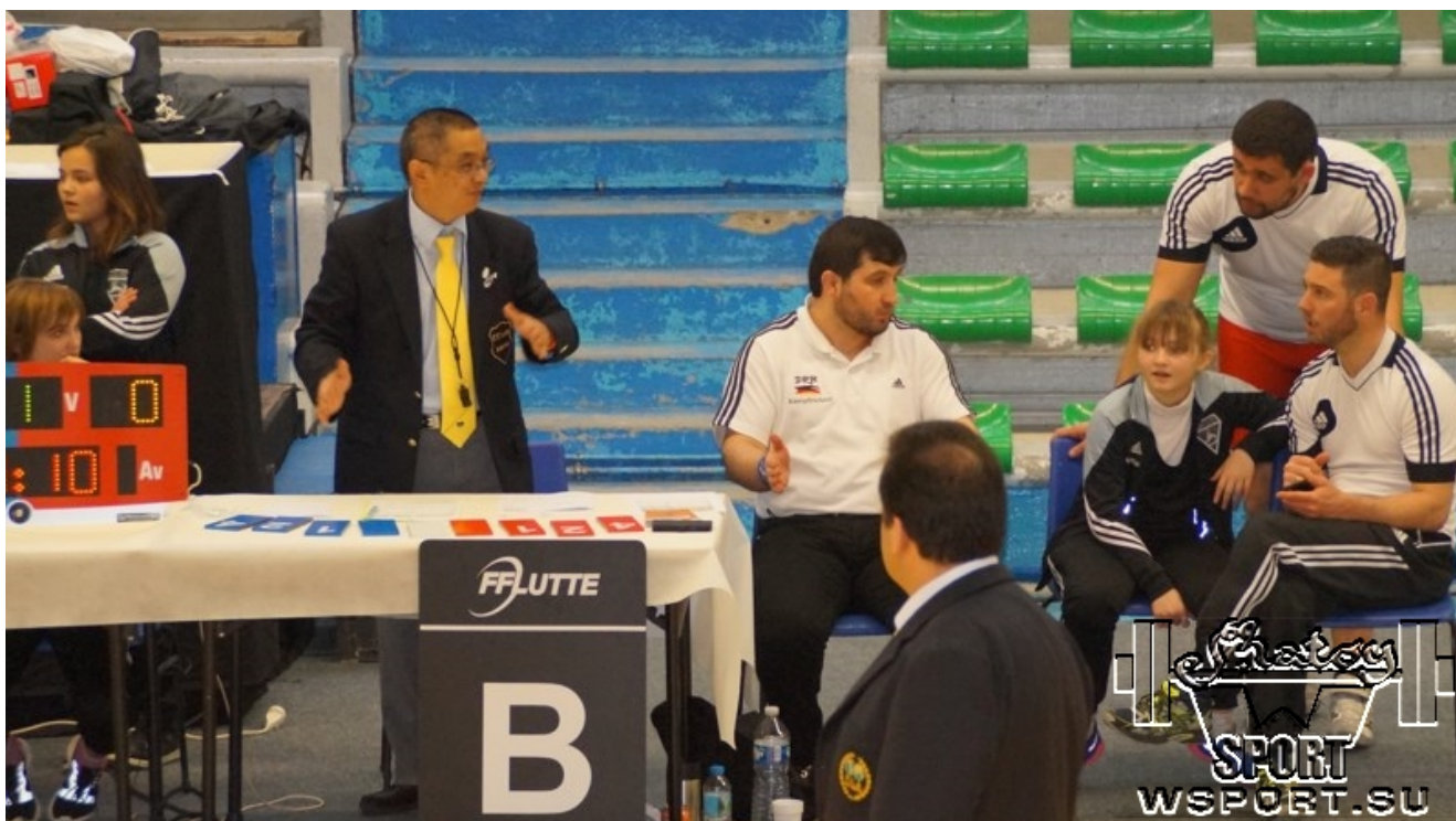
Обсуждение спорного момента