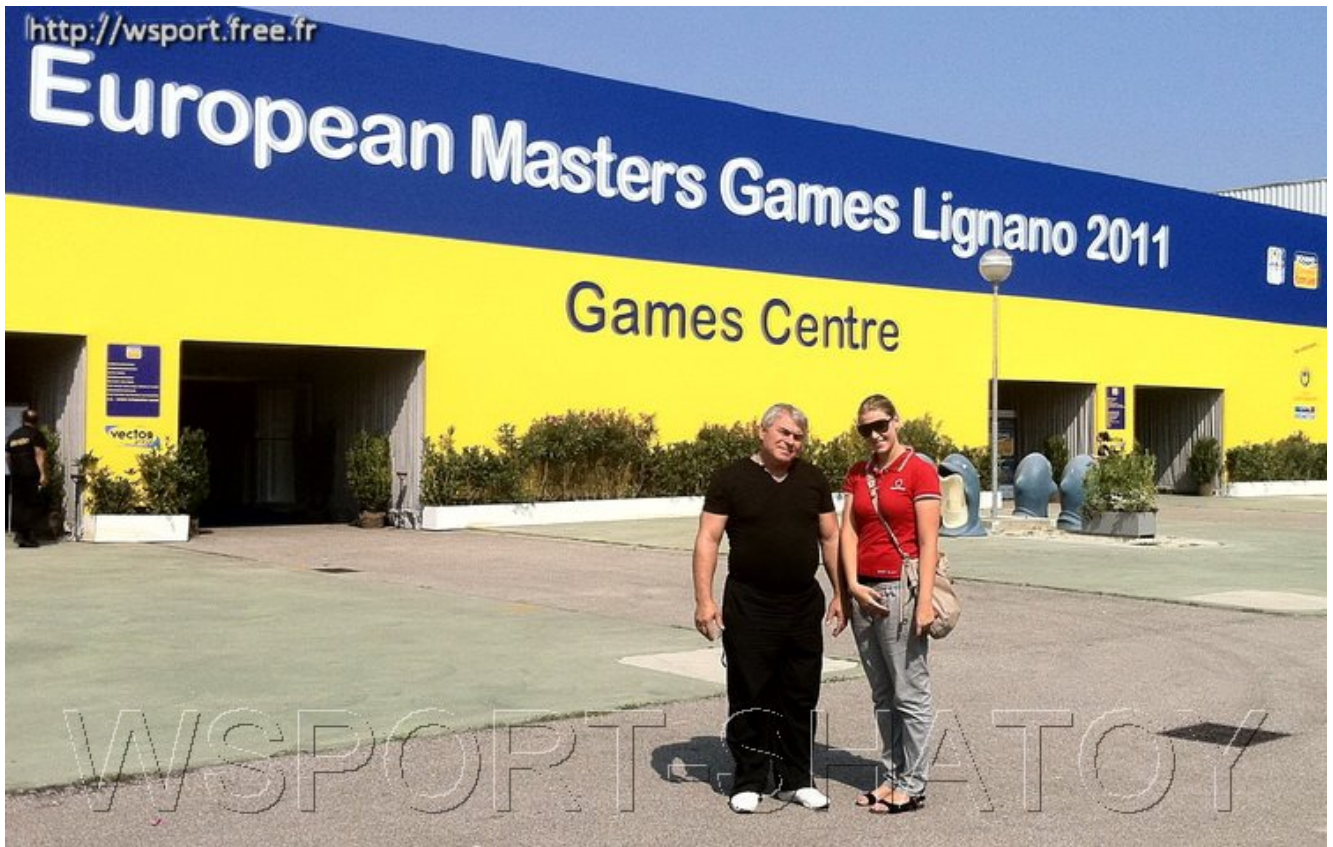
ФОТО С ПОКЛОННИЦАМИ