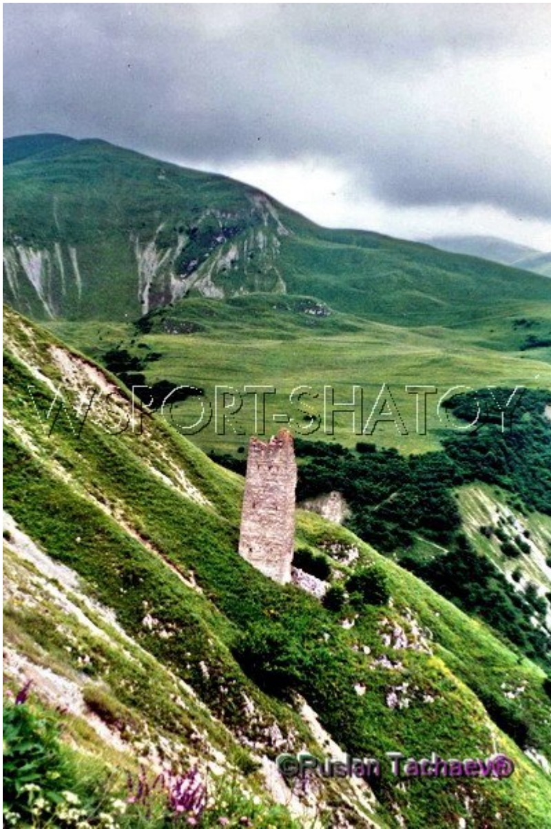
Чіеберла - Ачал.