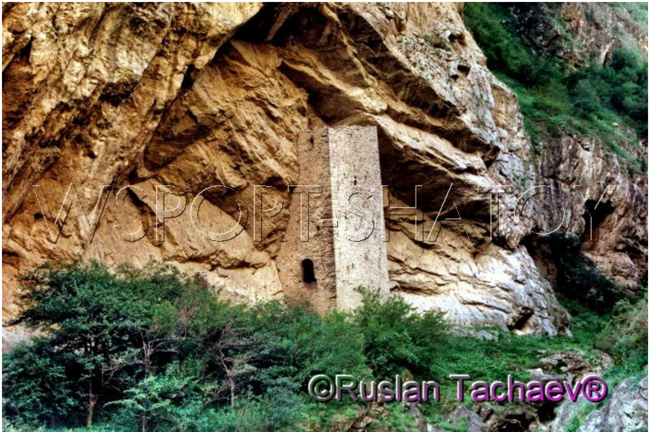
Ушкалойская боевая башня.