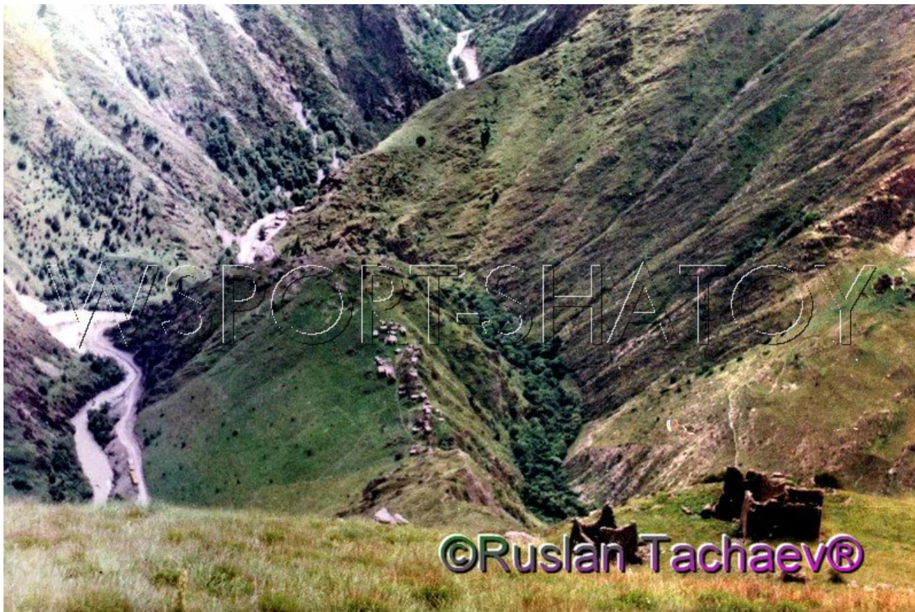
Малхйисте. Вид сверху на Мертвый город.