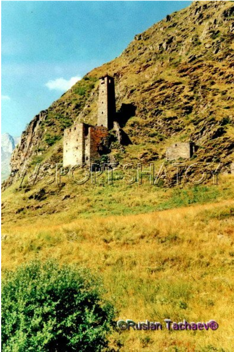
Комплекс в Меши.