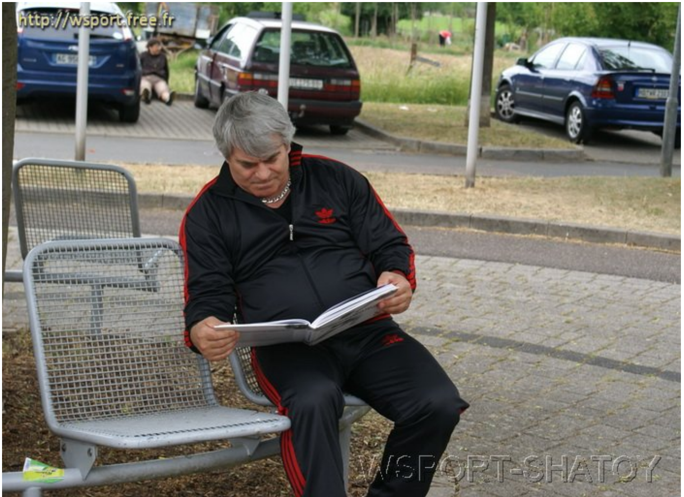
Перед выступлением надо отвлечься