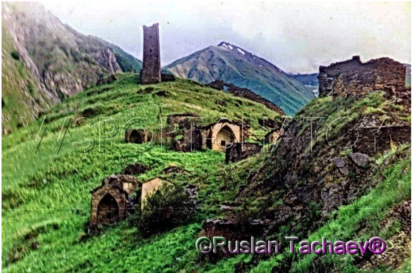
Цой Педе. Мертвый город.