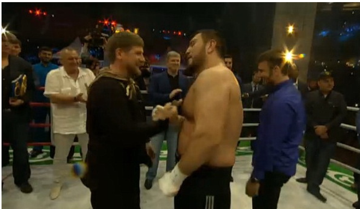
После боя Руслан Чагаев благодарит Рамзана Кадырова

Два года назад, благодаря встрече с Главой Чеченской Республики Рамзаном Кадыровым и его поддержке, Чагаев вернулся на ринг и вернул себе титул регулярного чемпиона WBA.