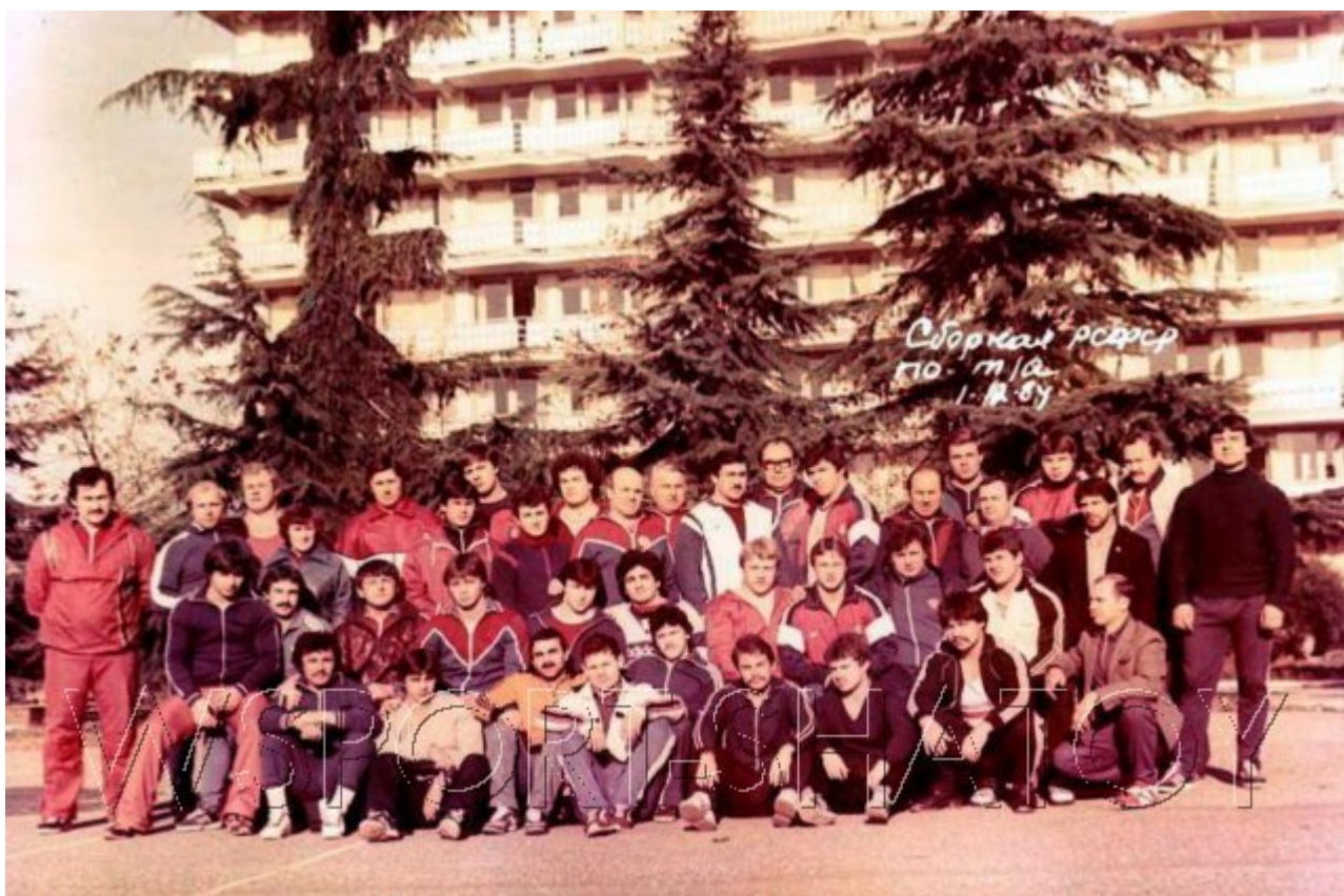
1984 год, Феодосия. Сборная РСФСР.