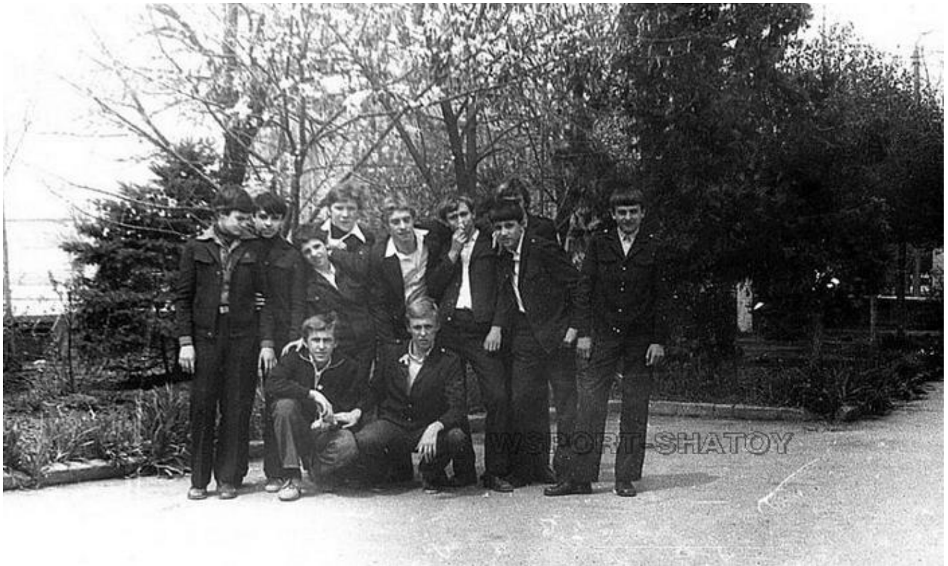
Спецкласс по плаванию