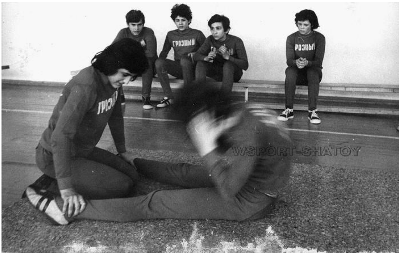
На тренировке, 1982 год.