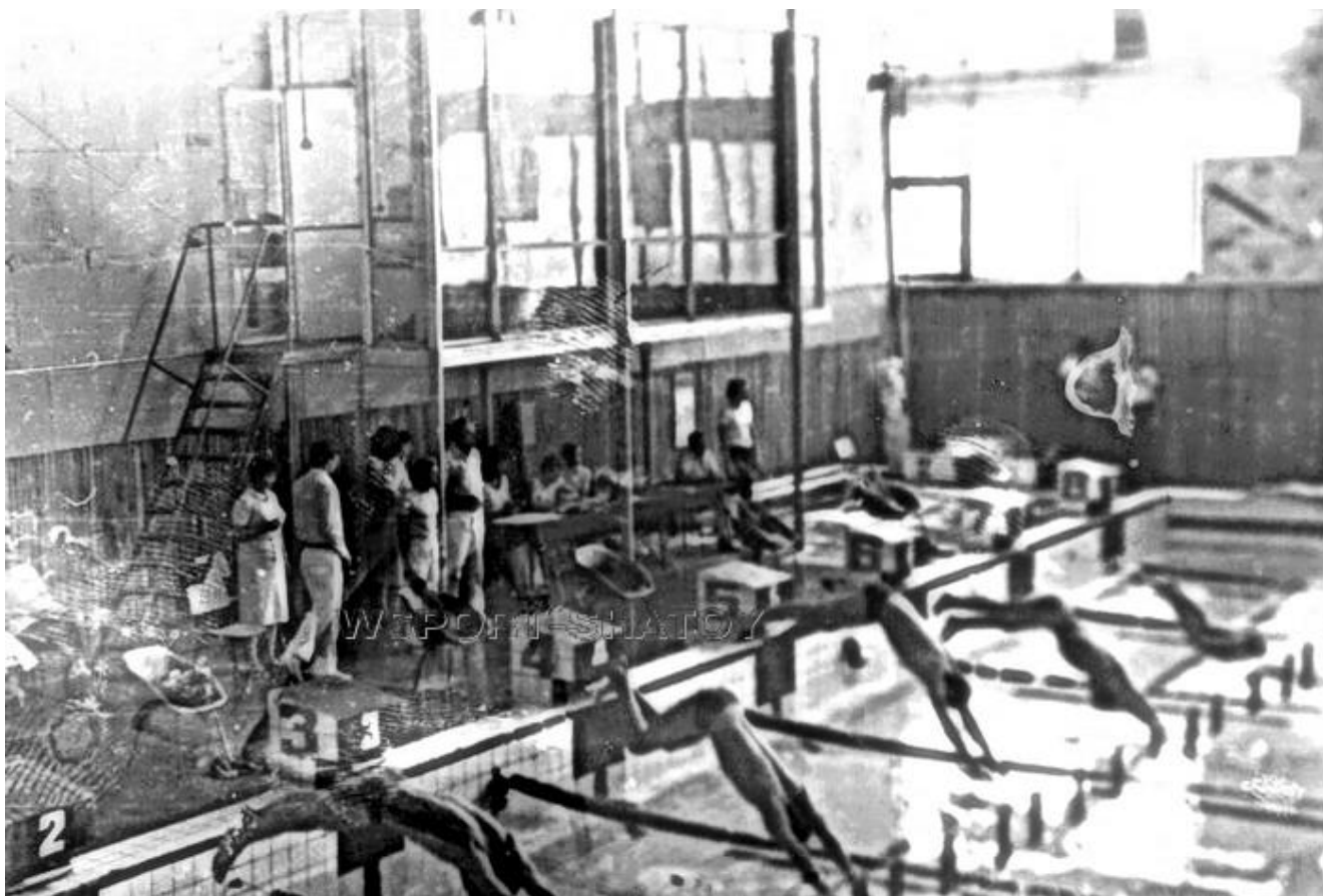
Очередные соревнования в "Садко"