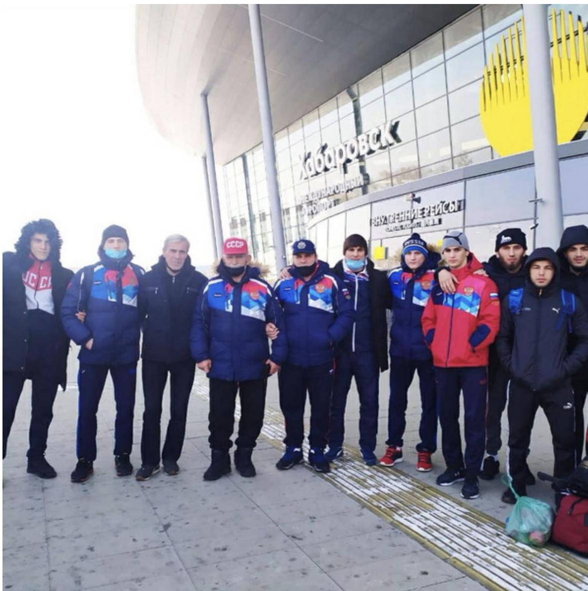
Команда Чеченской Республики прилетела в Хабаровск