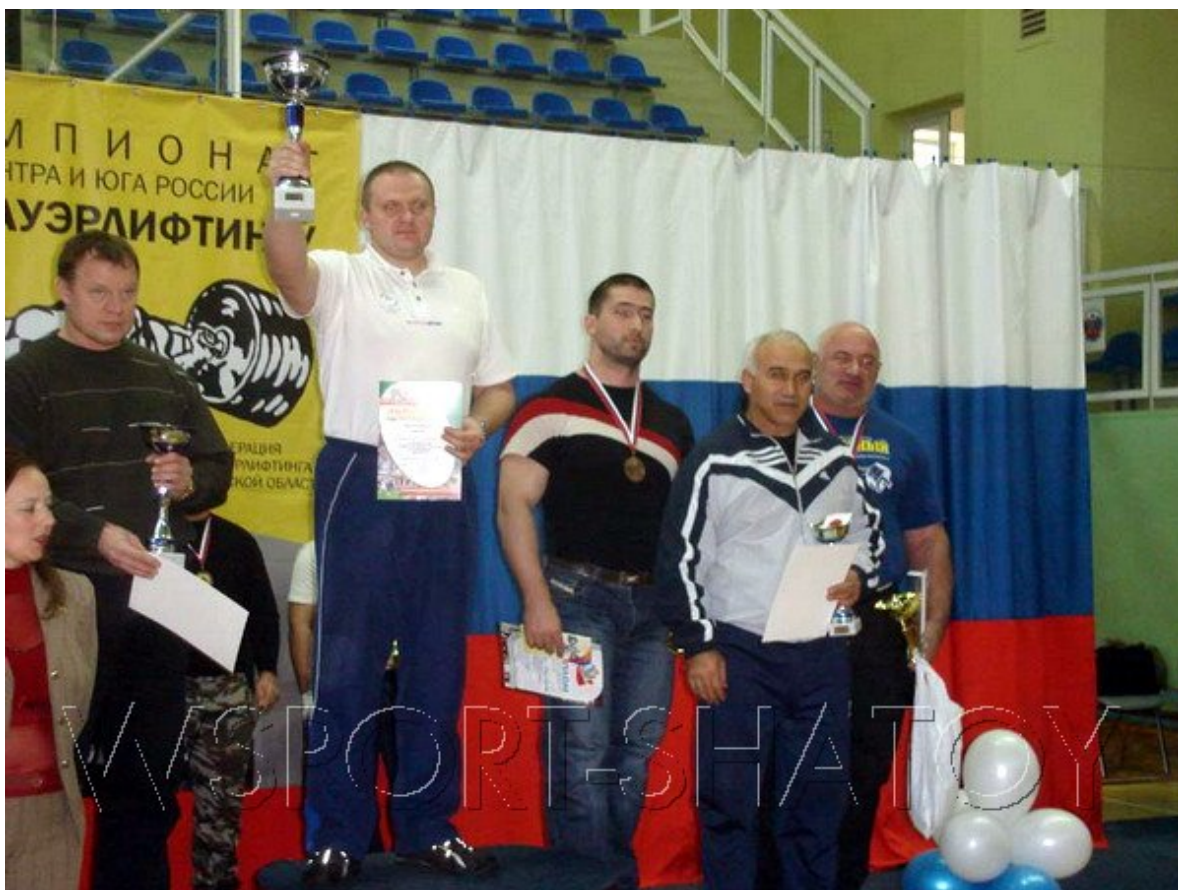
Команда Чечни на третьем месте

«сгорали», как говорят спортсмены, еще до выхода на помост и, как следствие, показывали результаты намного меньше своих личных рекордов. Также необходимо работать над техникой. Однако, несмотря на такие уязвимые моменты, команда Чечни заняла третье общекомандное место среди 21-й команд-участниц.