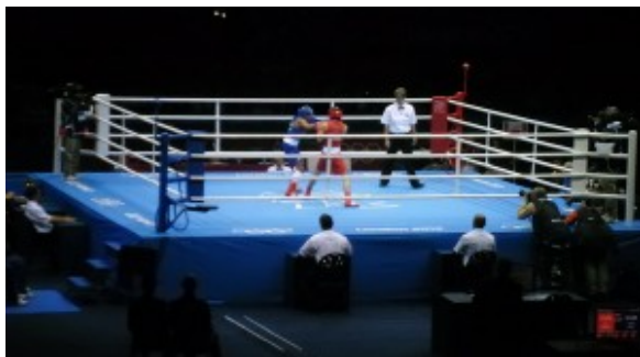
Соревнования по боксу

Когда выдавалось немного свободного времени, смотрел соревнования по другим видам спорта, которые проходили в зале EXCEL – настольный теннис, бокс, тхэквандо и, конечно, тяжелая атлетика.