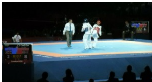
Соревнования по тхэквондо

В кассах билеты невозможно было купить, только через интернет, хотя и на сайте Олимпиады практически невозможно было приобрести билеты.