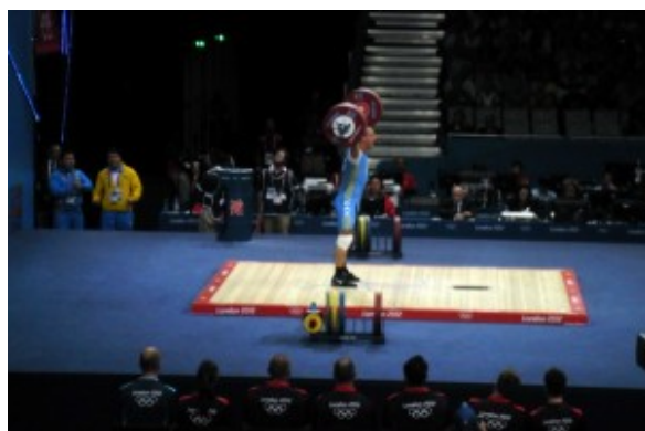
На помосте Илья Ильин

Вместе с Апти Аухадовым я наблюдал соревнования по тяжелой атлетике среди мужчин в весовой категории 94 кг. Это были напряжённые и интересные состязания, где борьбу вели тяжёлоатлеты из Казахстана, России, Молдовы и Ирана. Но скажу, что среди них выделялся Илья Ильин из Казахстана.