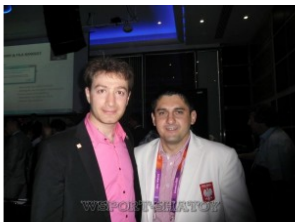
Айдамир и президент Федерации борьбы Польши Крыштов Клозек