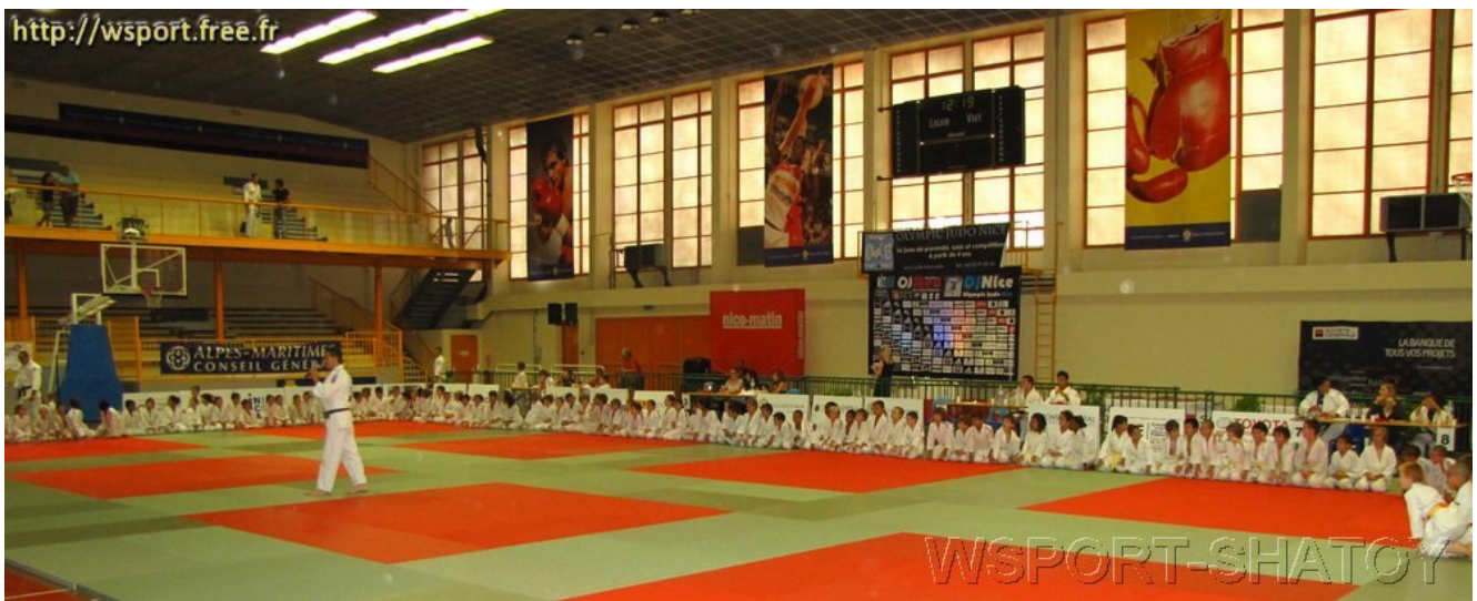
Участники соревнований 2003-2004 годов рождения