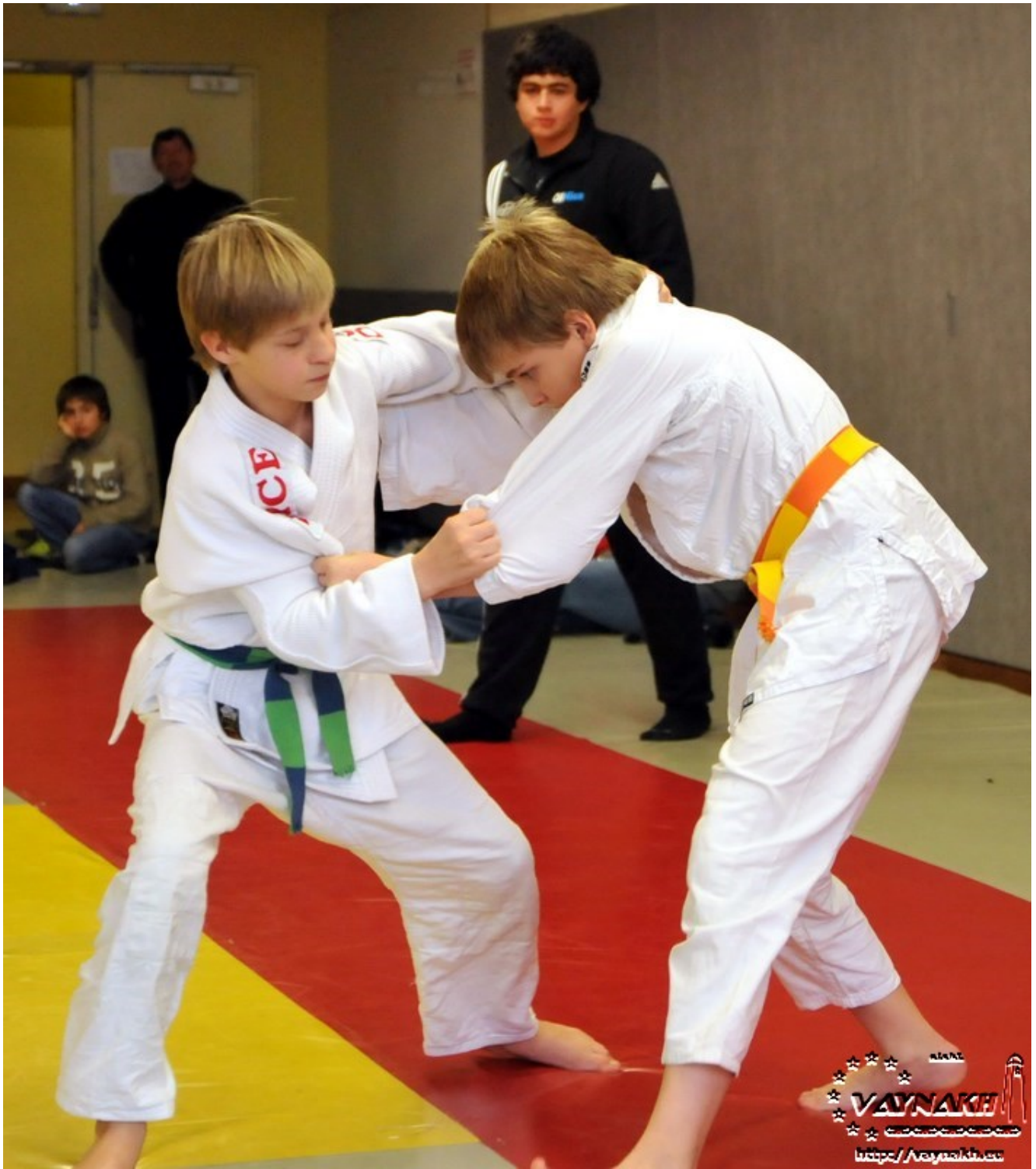
На ковре два блондина