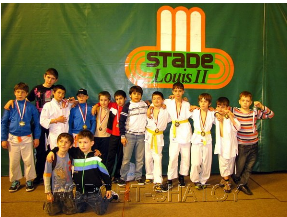
Наши чемпионы и призеры