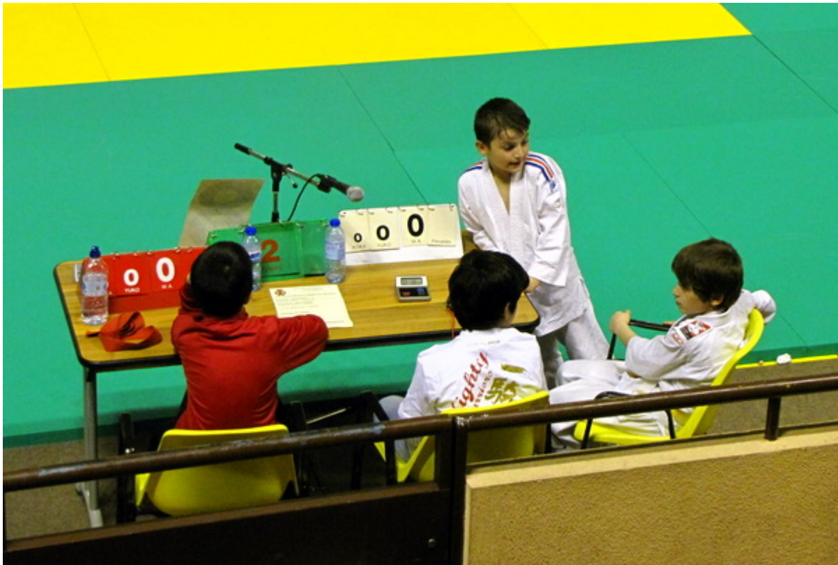
Решили посидеть за судейским столиком