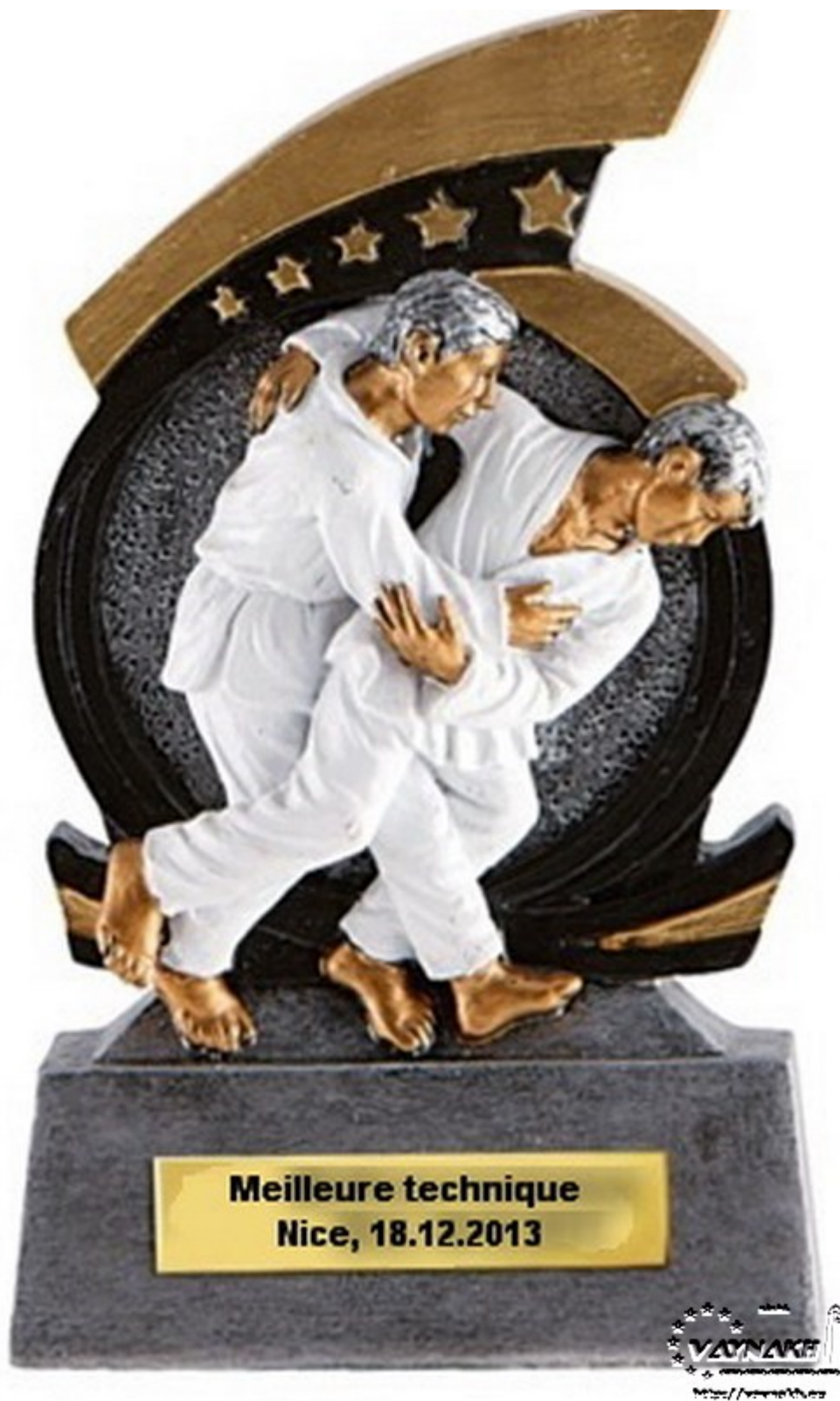
Приз за лучшую технику