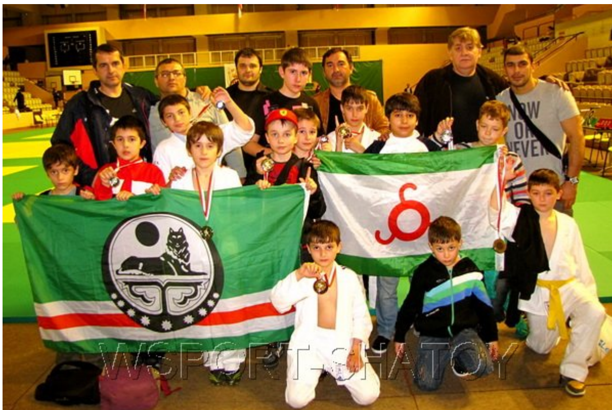
Родители, спортсмены, тренер.