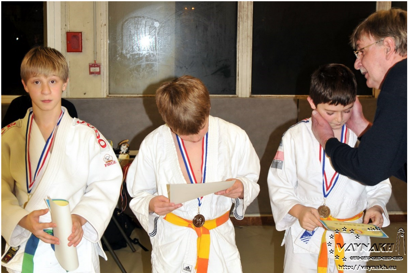
Магомед недоволен результатом