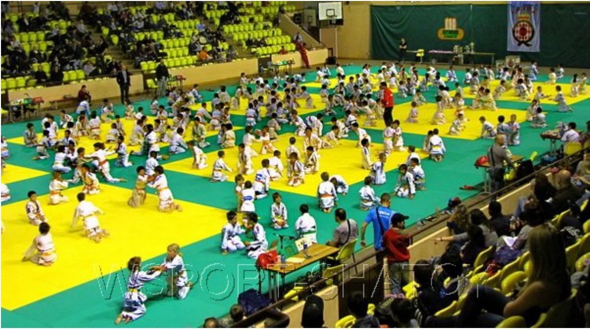
Разминка младшей группы