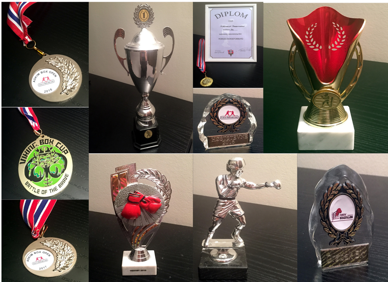
Часть наград Алхазура Магамадова