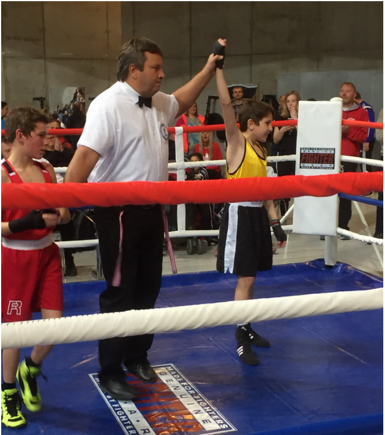
Алхазур Магамадов становится 2-кратным чемпионом Норвегии