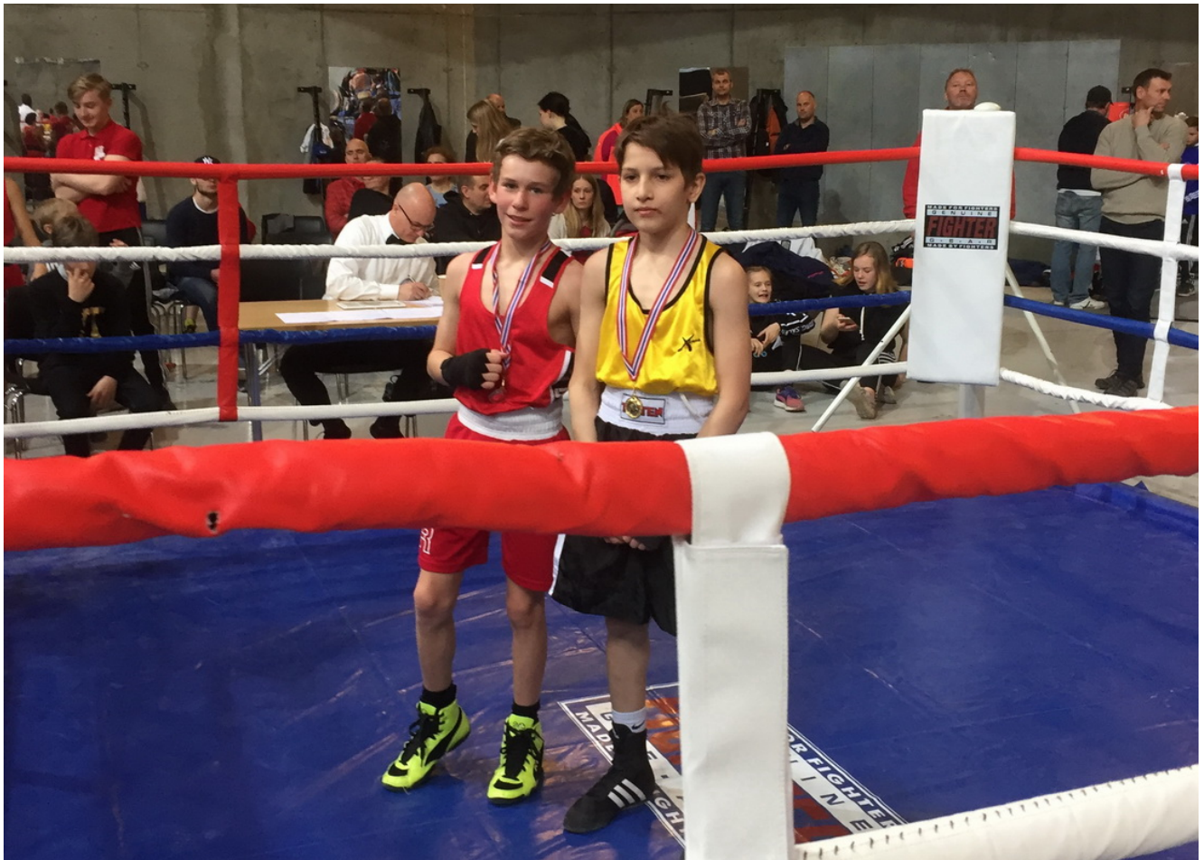
Финалисты первенства Норвегии-2017