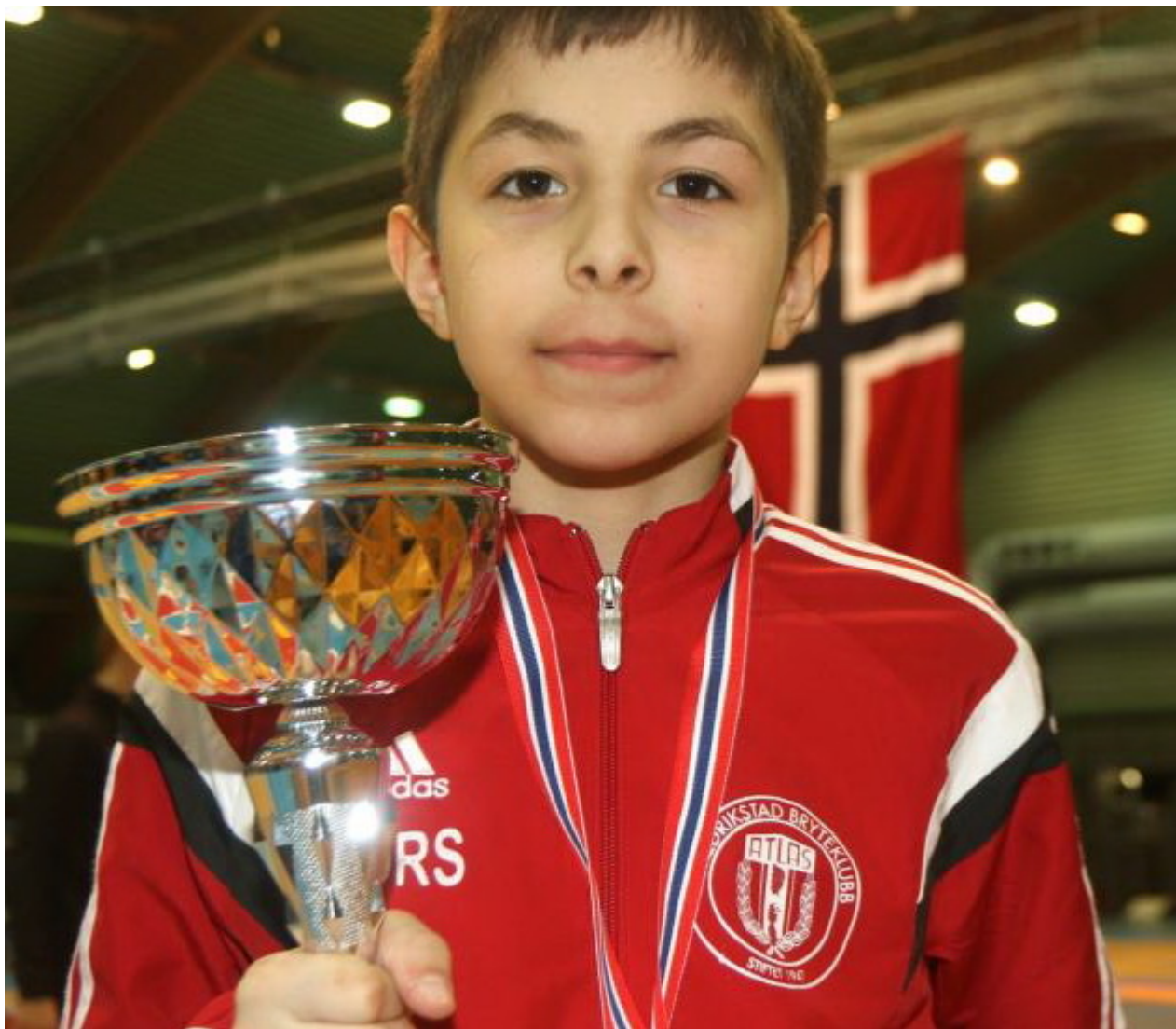
Чемпион Норвегии Лорс Тимирбиев