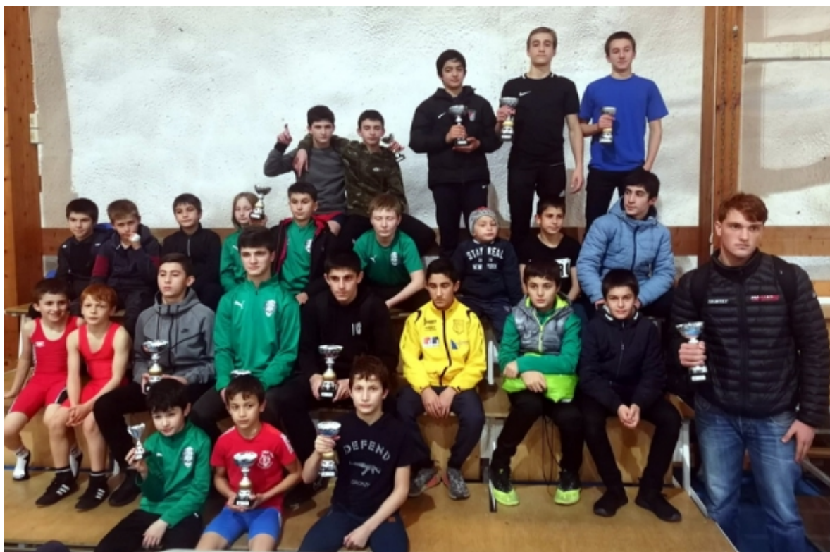
На первом турнире

Желаем новому клубу счастливого пути. Дала аьтто бойла.