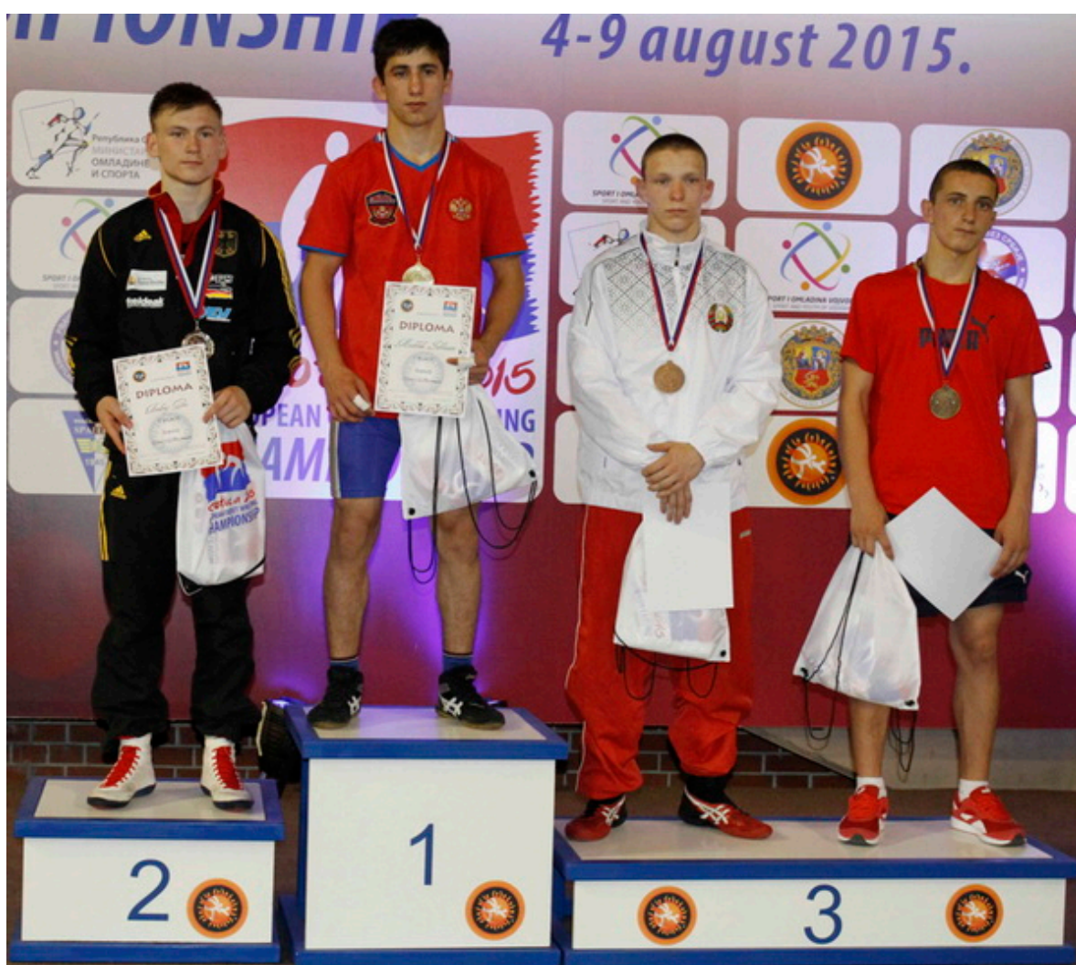
Первенство Европы-2015. Призеры категории 58 кг.