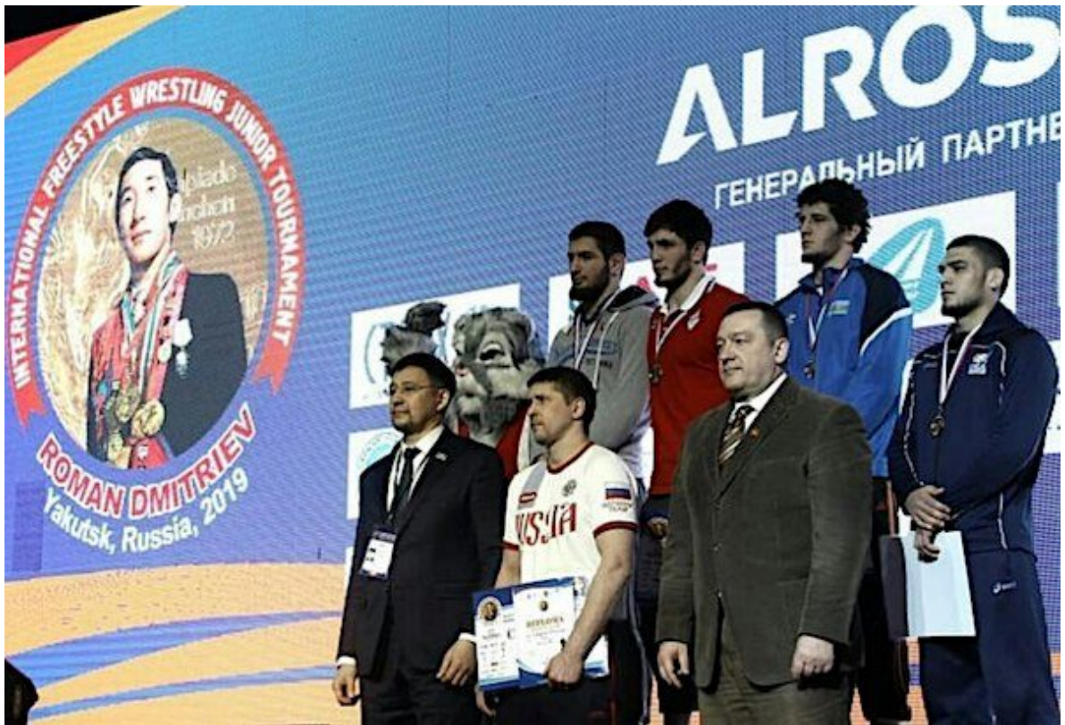
Пьедестал почта весовой категории 79 кг