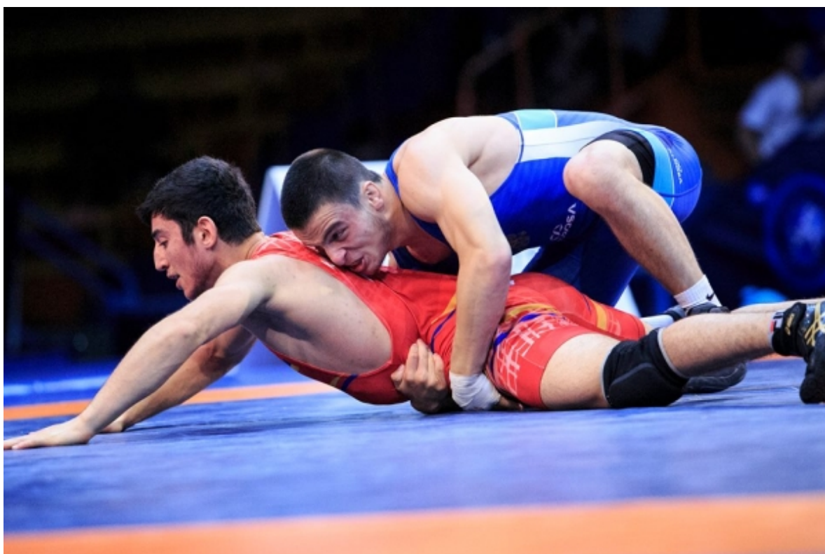
Муслим Имадаев – чемпион мира-18 среди юношей