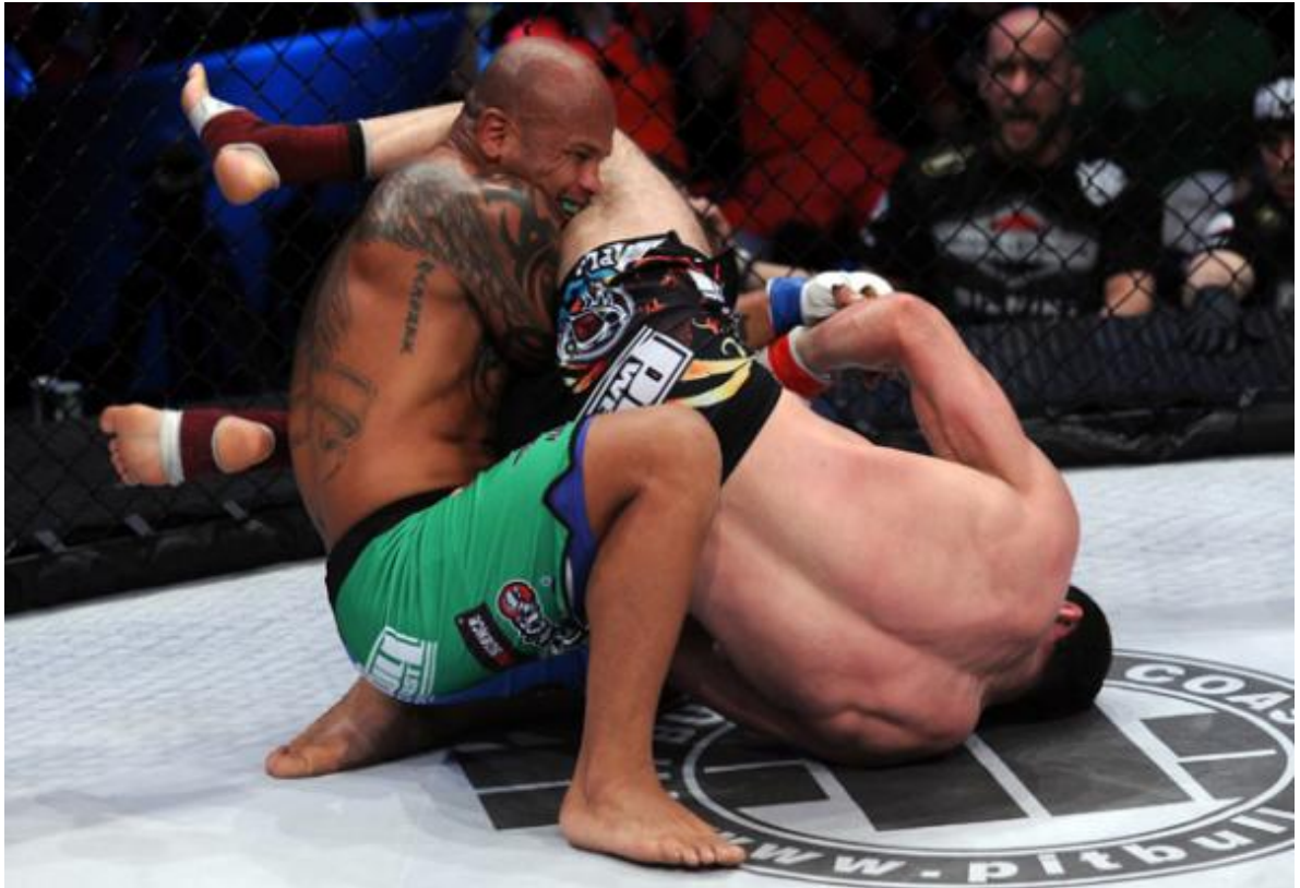
Мамед проводит болевой прием

[youtube id=»netTc9M6pPA» width=»620″ height=»350″]