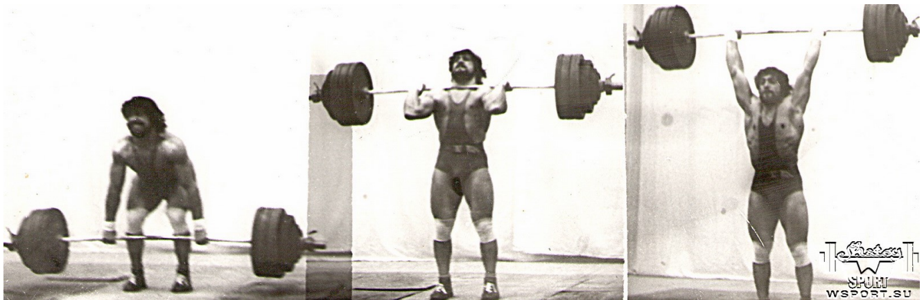
Толчок 200 кг