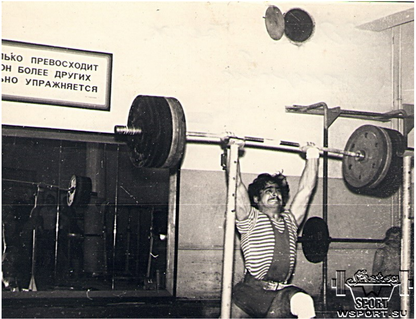
200 кг на тренировке