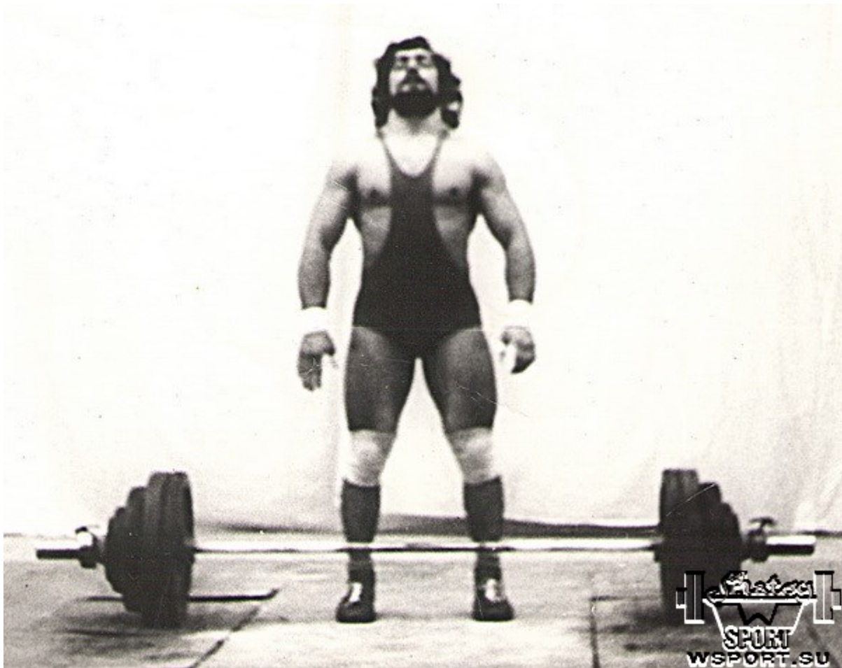
Рывок 150 кг