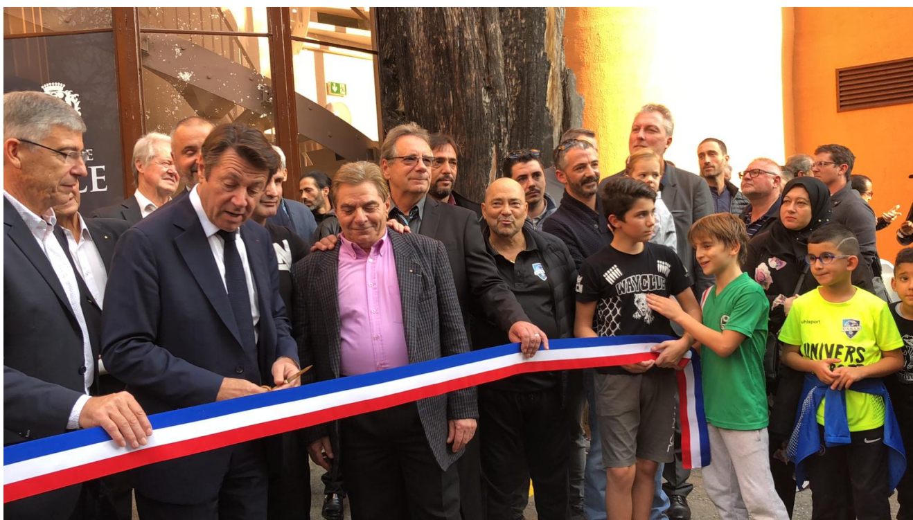
Мэр Ниццы Кристиан Эстрози перерезает ленточку

[youtube id=»70_dUeFrPE4″ width=»600″ height=»350″]