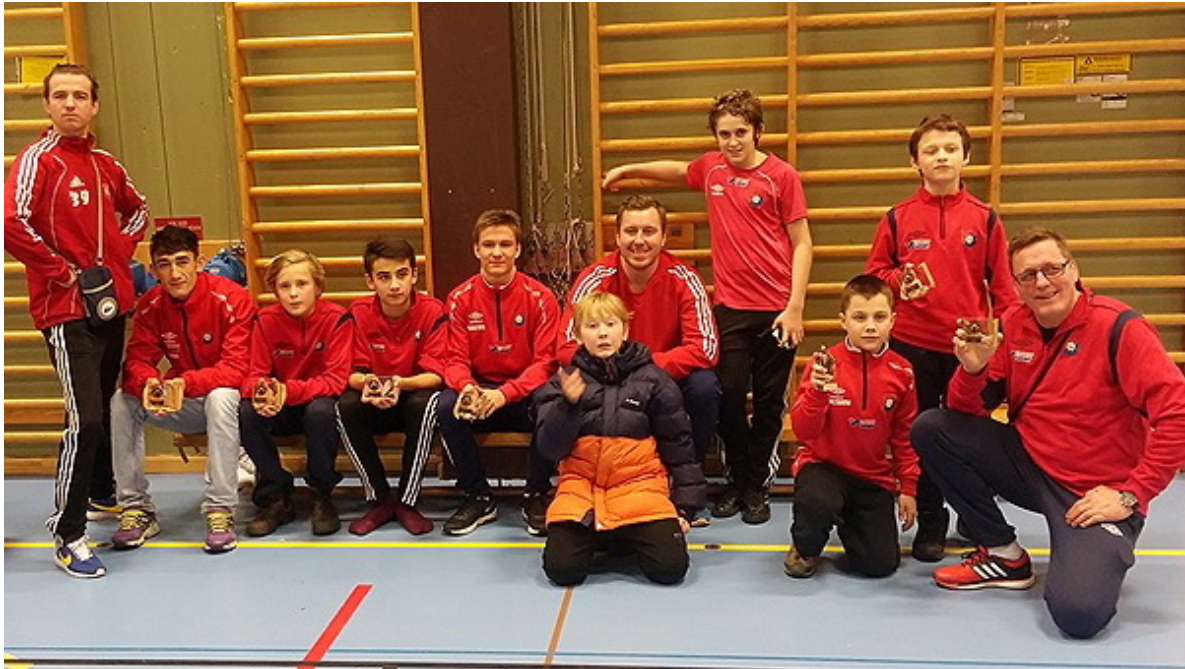
Команда из города Эргрюте