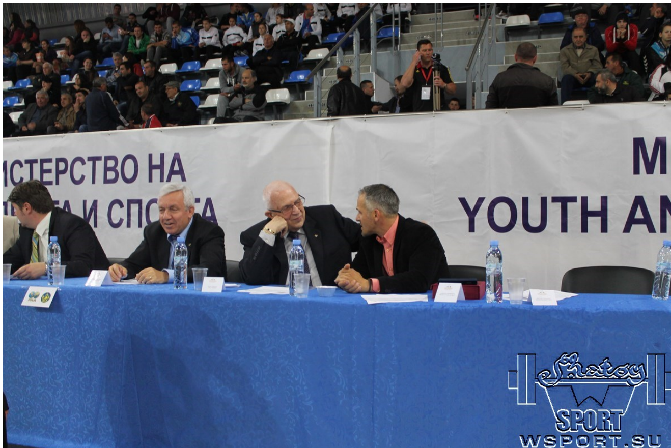
Президент Европейского Совета по борьбе Цена Ценов.