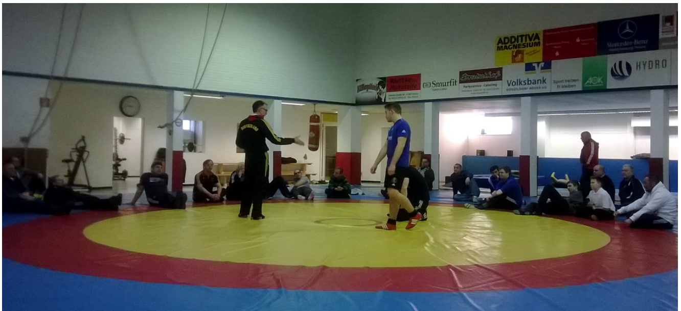
Занятия ведет судья олимпийской категории Уве Манс из Германии