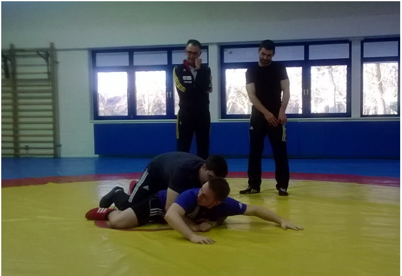
Занятия ведет судья олимпийской категории Уве Манс из Германии