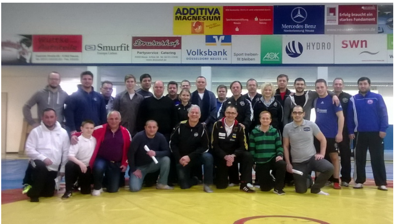
Участники судейского семинара