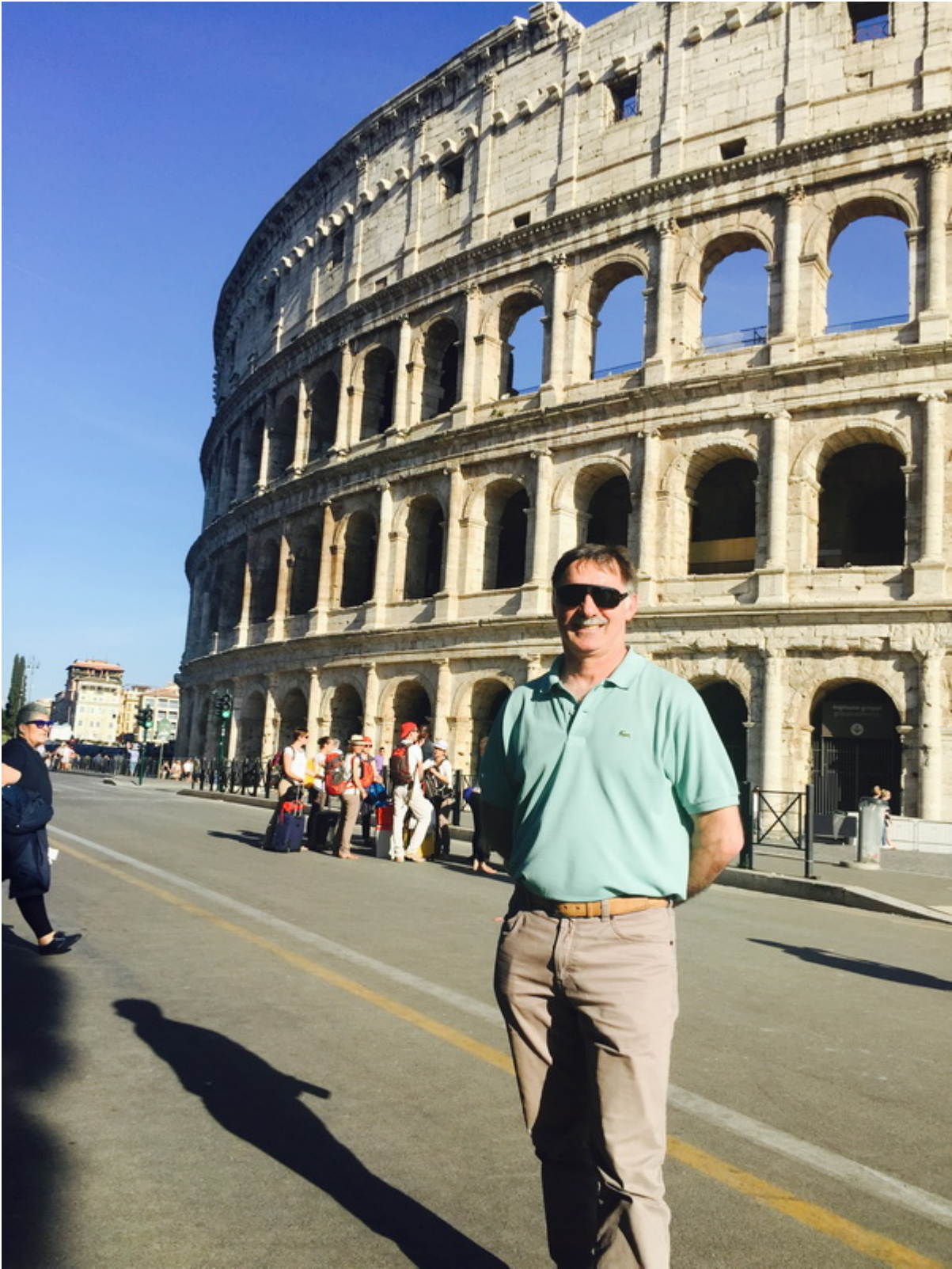
У древнего Колизея