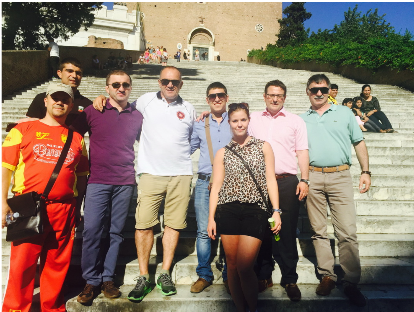
С судьями-коллегами на экскурсии после экзамена