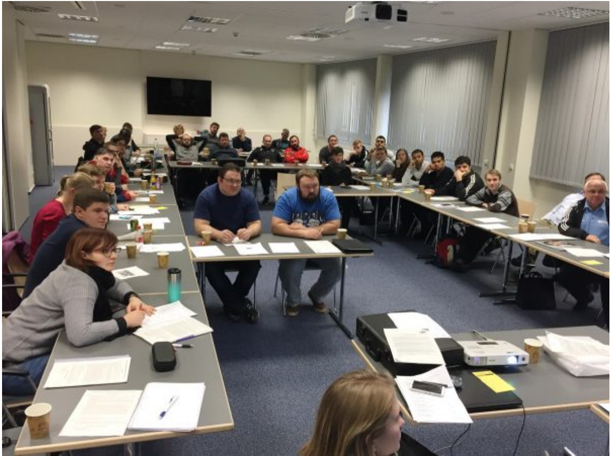
Судейский семинар в Хеннефе 5-7 января 2018г.