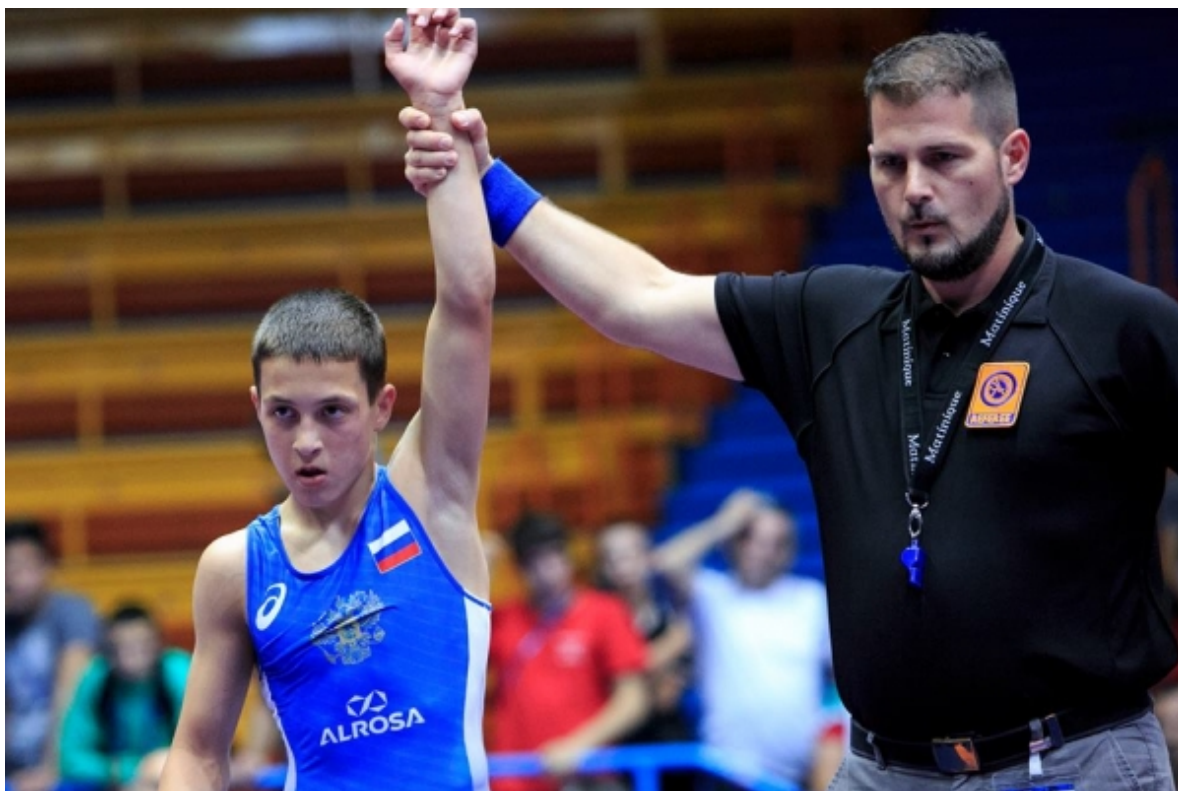
Ильяс Яндаров – чемпион мира-18 среди юношей